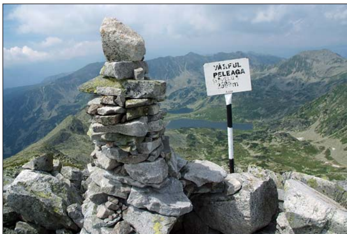
Kilátás a Peleága-csúcsról a Bukura-tó irányába

bolt a vihar a hegyen, ami minket az Erdélyi-Vaskapu-hágónál ért utól. Hunyadi János emlékművéből már csak a beton árválkodik (ott is gyűjtik a fémeket?), a buzogányának nyoma tünt.