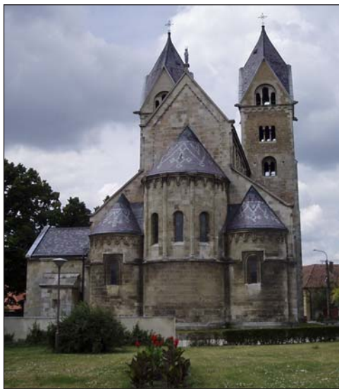
A templom látképe