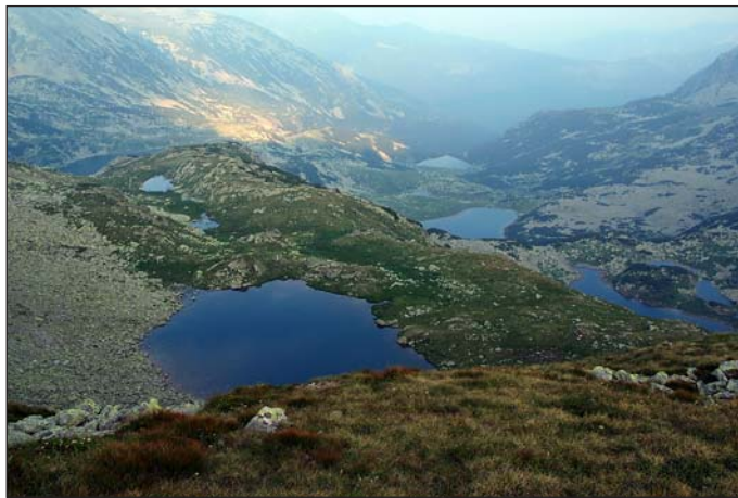
Glaciális tavak. A hatalmas Bukura-tónak csak kis részlete látszik

Mindenféle E-vel megtöltött levesporok (utólagosan guar gumik!?) elfogyasztása után már a holnapot terveztük. A szelet már megszoktuk, de nem északi irányból. Ami hatalmas esővel kísérve majdnem ránk döntötte a sátrat. Nem örültünk az újbóli égi áldásnak, de Nap szikkasztotta kishazánkra gondolva elviseltük volna - otthon. Itt, 2041 méter magasan, a Bukura-tó partján, rettenetes és félelmetes volt. Amikor havazásra váltott az időjárás, úgy határoztunk,