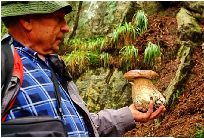
Gombaparádé. A pirosak szépek, de halálosak!