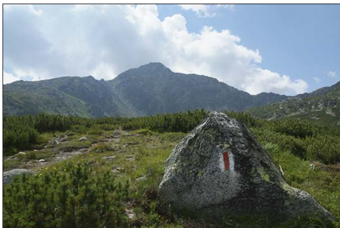
Háttérben a Retyezát-csúcs nyugati oldala

Én megmosakodtam a Táu Portii tóban, majd meg is vacsoráztunk. Már esteledett mikor a Bukura-tóhoz (2041 m) értünk és sátrat vertünk. Kőfalakkal körbevett sátorhelyek foglaltak voltak, így egy füves placcot néztem ki magunknak. Az éjszaka csöndjét csak a tomboló szél és a mellettünk sátorozó csehek veszett ordítóása törte meg, na