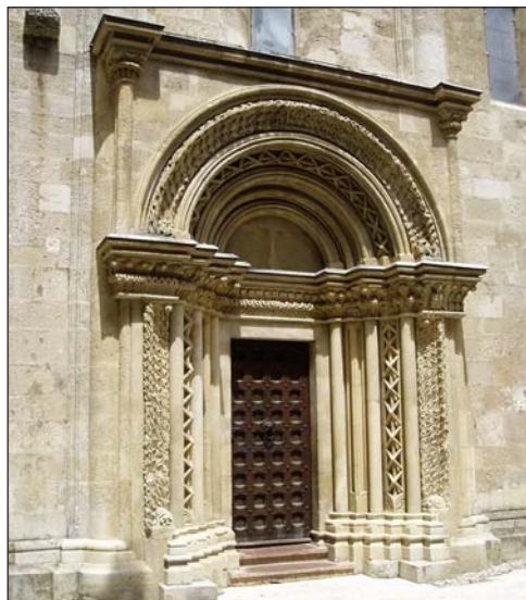
Díszesen faragott kapuzat