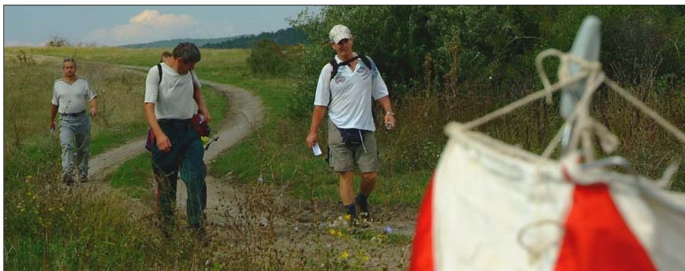
Az 50 km-es távon az utolsó, a 7. ellenőrző ponthoz közeledve