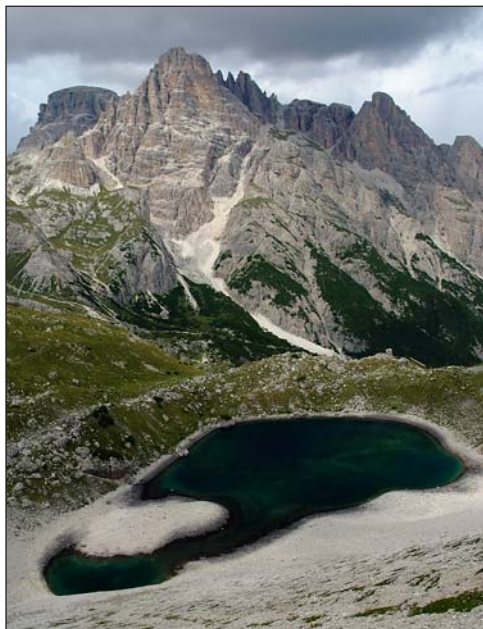
Mit rejt a tavacska?

„Az erotikus képzettársításhoz nem feltétlen szükséges a meztelen emberi test látványa. Személyiségünkben rejlő tudatunkat, fantáziánkat számos ráutalós objektum szólíthatja meg.” olvasom Féjja Sándor cikkében. Bizonyára „piszkos” a fantáziám, mert erdőt-hegyet járva sok esetben találkozom testiségre asszociálható természeti formákkal. Ölelkező fák, bugyi formájú erdőirtások, gömbölyded gyümölcsök, csöcsös szikla alakzatok stb. hangulattól, megvilágítástól, évszaktól függően mást és mást jelenthetnek. Első példaként nézzük az alanti képet. (15. old.)