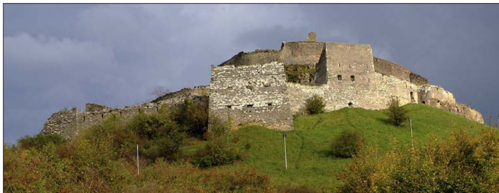
Kóhalom (Rupea) vára. Brassó felé vezető 13. számú (E60) főúton, a megyehatártól kb. 15 km-re van