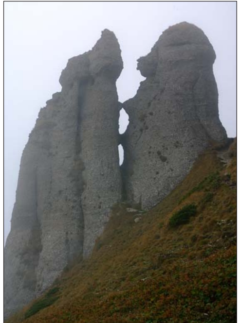
Pletykálgodó vénasszonyok a Csukás hegységben