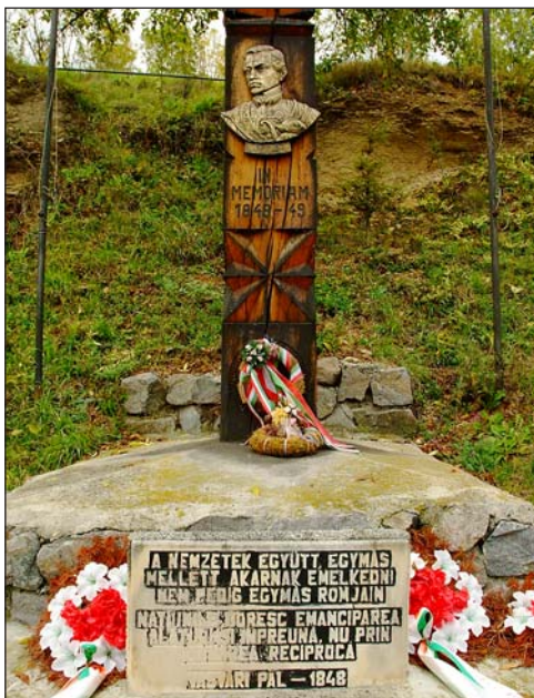
Vasvári Pál emlékoszlop és kinagyított részlete. A gondolat napjainkban is aktuális