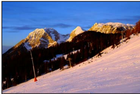
Gyalogosan a Szlovén síparadicsomban