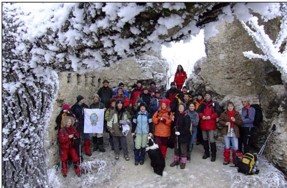
PKE óév-búcsúztató túrája a Vértes-hegységben