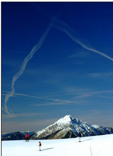
A jól kiépített sípályák egyike

A leírtakat több ezer síelő és hódeszka igazolta. Gyalogként jártam be egy-két magasabb pontot, élményben így is volt részem bőven. Íme néhány kiragadott fotó a sok közül.