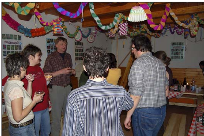
A felújított Guba ház belülről