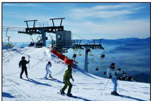
Nagyüzem a sífelvonókon