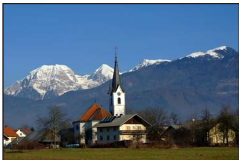
Krvavec (1853m) a kép jobb felső részén van