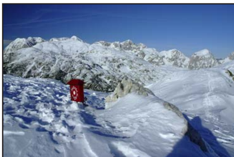
Kilátás a Veliki Zvoh 1971 m-es pontjáról