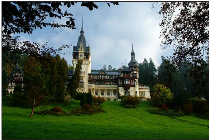
A királyi kastély Bustényban