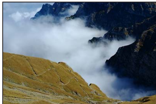
Sok felvétel készült a gyorsan mozgó felhők játékát kihasználva. Alsó képen alig, de látszik a Fogarasi havasok vonulata