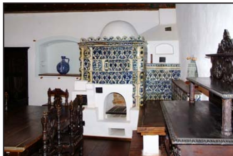
Tűzhely a paraszt konyhában és kályha az uri étkezőben, Töröcsvár