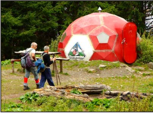
Az előregyártott műanyag-menedékház