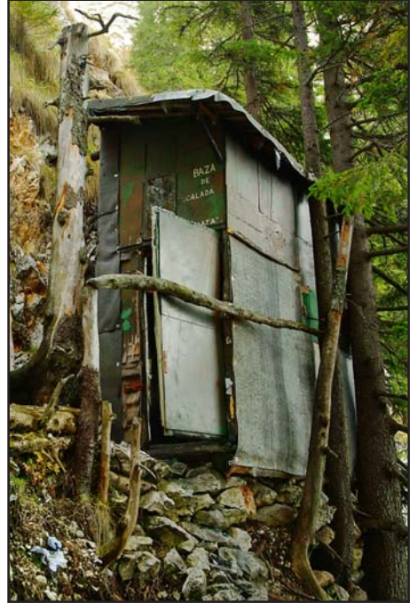
Menedékház újrahasznosított anyagokból