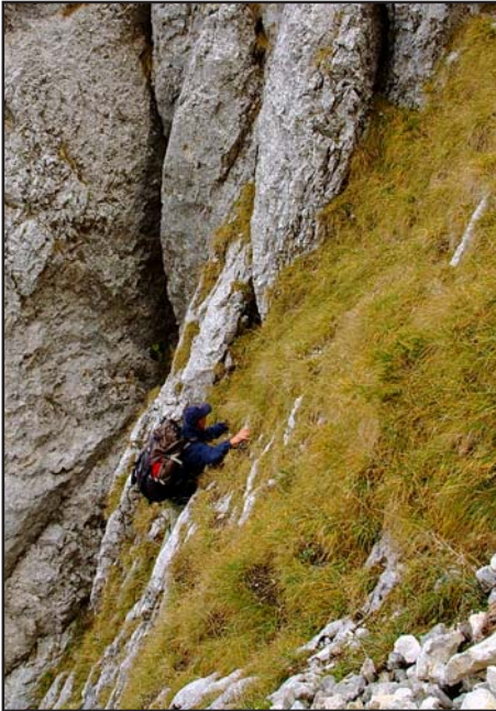
Szabadmászás a Királykövön. A nedves kövekbe kapaszkodva voltak igen nehéz pillanatok