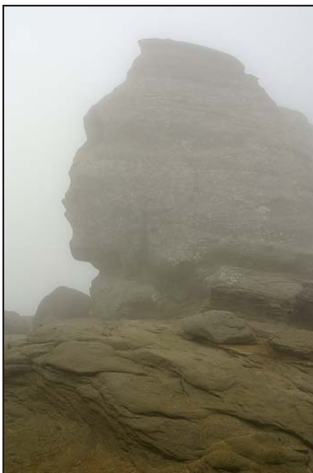
A híres kőképződményt, a Sfinx-et alig lehetett a sűrű felhőben felismerni

Az Omu menedékházban csorba formájában elfogyasztott ebédünk után bejártuk a 2505 méter magas Omu (Ember) csúcst. Most kezdődött túrán legnehezebb része, ugyanis le kellett ereszkednünk közel 1800 méter szintet. A Szarvas-völgyön keresztül kezdtük meg az ereszkedőt, s képet kaphattunk a talajerózióról. Közel két és fél óras ereszkedés után értünk a „a juhok megszámlálása” nevű sziklaszoroshoz. Majd enyhült az út lejtése, és áttértünk az eddig járt sárga sávjelzésű útról, a piros háromszögjelzésűre. A Costila tisztását elhagyva, erősen lejtős erdei úton értük el Bustényt. A főutat követve, még három kilométert gyalogoltunk az aszfalton, s értünk az autóhoz. A Bucsecs bejárása volt egybehangzó vélemény szerint túránk fénypontja.