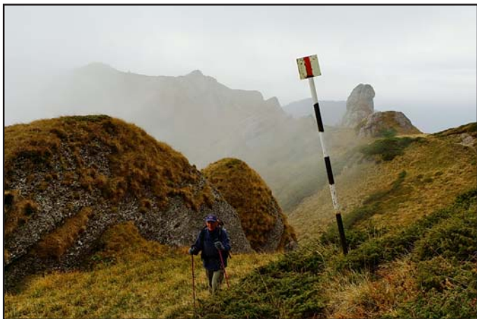
A csodás táj kezd kirajzolódni előttünk

Sajnos a Csukás 1954 méter magas csúcsára érve ismét erőt vett magán a köd, s Orbán Balázs által leírtakat csak sejtettük. A gerinc a csúcsnál DNY-i irányt vesz, s szerencsénkre a köd is odébb állt. Időnk nem lévén az „Ördög keze” szikla alakzatot nem tudtuk felkeresni, de kár-