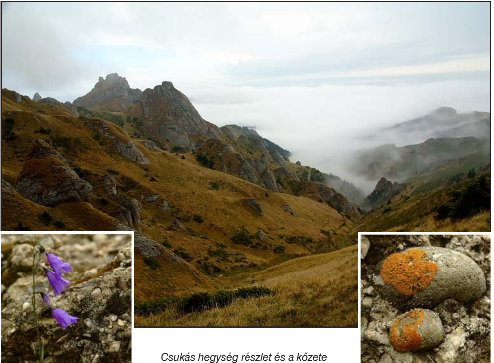
Csukás hegység részlet és a kőzete

Lejegyezte: Orbán Imre MKE , fotók: Nagy PéterKEE