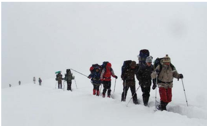
Harc az elemekkel