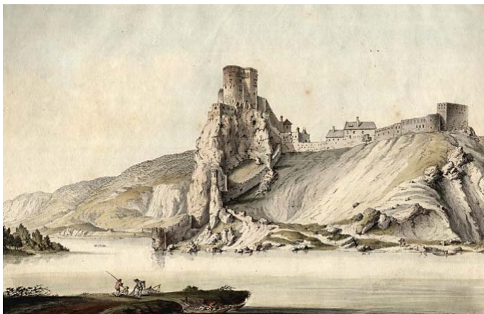
Rajz a dévényi várról

Az 1241-42-es tatárjárás pusztításai elmúltával az országban hatalmas méretű várépítkezések kezdődtek. IV Béla király ösztönzésére a főbb tisztségeket ellátó nagyurak, gazdagabb nemzetségek és várjobbágyok a védelemre alkalmas helyeken sorra emeltették a váraikat. A példát maga az uralkodó mutatta, aki, mint azt a római pápához írt levelében is közölte, a Duna folyó vonalát erősítette meg. A rommá vált Pest helyett a túldoldali Várhegyre költöztette fel a betelepített vendégpolgárokat / hospeseket/, míg felesége Mária királyné Visegrádnál építtetett várat. A Ny-i határszélén, a hadászati fontosságú Pozsony ispánsági várát is kővára építette át a király. A királyi várépítkezések keretében 1242 után de még 1271 előtt a Morva és Duna folyók találkozásánál égnek meredő hatalmas sziklaszirthez, a morva fávár elpusztult helyére, királyi parancsra erős kőfalakkal és öregtoronnyal megépítették Dévény várát. Legkorábbi formájában egy hatalmas tornyot körbevevő várfalból állt mindössze. 1271 áprilisában történt meg Dévény erősségének első, fennmaradt írásos említése, amikor is II. Ottokár cseh király seregével betört a Magyar királyság területére. Katonái elfoglalták Dévény, Pozsony és Stomfa várait, majd É-ra fordulva Szentgyörgy /