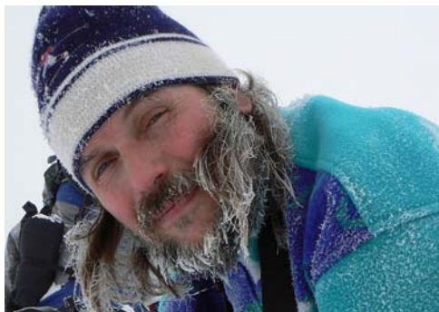
Deresedik a Józsi szakálla

Innen már széles erdei út kanyarog a majszini hágóig. Itt autóval jártunk már, nem volt tervben a gyalogos meglátogatása. Élvezetesen lehetne csúszni a túraléceken, ha nem tapadna rájuk a hó. Érzik hogy melegebb van, azért tapadósabb a hó. Elő a vaxot, vagyis a gyertyát, jól megkenjük a lécek talpát. Ez már más, sorra előzünk mindenkit. Az Iza forrásasoz vezető elágazásnál újabb pihenő, kis falatozás.