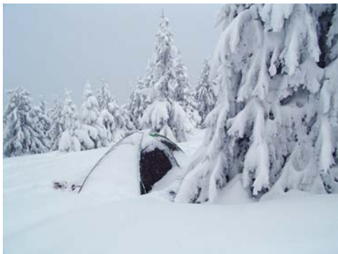
A 2. éjszaka után

Első pihenőnk egy esztina mellett van, előkerülnek a csokik és különböző csoda energiakészítmények. Nagy sikert arat az új dió-méz receptem, mindenkinek ízlik, szorgalmasan kínálom is, mert az első szakaszon már úgy érzem a hátzísákom túl nehéz. Vidám csevegés majd indulás tovább, neki a hegynek, erdőnek, tisztásról tisztásra. Lassan haladunk, sok a 90 fokos kanyar, az útkeresés, légvonalban 1 km / óra a haladási sebesség. A túra első napján megengedhető, kell az akkomodáció, át kell térni a mozgásszegény életmódról az intenzív erő-kifejtésre. A pihenők egyre sűrűbbek, méregetjük a távolságot az első táborhelyig. Ilyen ritmusban sötét lesz, mire odaérünk. További tájékozódási gondok jelentkeznek, kezdenek fáradni a menetelők, telik az idő. Egy erdőszélén állunk meg táborozni, kb. 1700 m magasságban, a fák menedéket nyújtanak az esetleg feltámadó szél ellen. Jól megtapossuk a sátrak helyét, elég mélyre kerülnek a sátrak, a szél biztosan nem kap alájuk. Jólesik a pihenés a sátorban, sötét lesz mire főzésre kerül a sor.