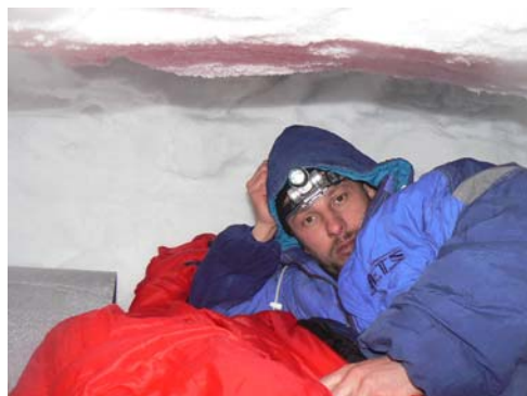
1m hó alatt pizsamaosztásra várva

A reggel továbbra is hóhullással fogad de ezúttal benn a sátorban is. A sátor falára lecsa-