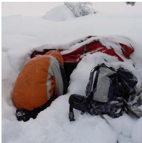
A mi vackunk