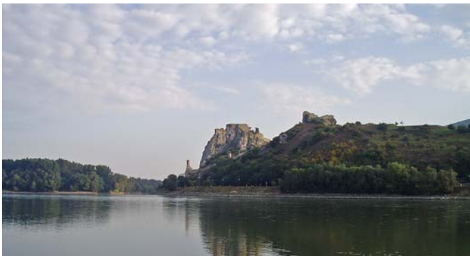
Dévényi vár a Duna felől

A középső várat mély száraz árok választja el a legregebb résztől, a XIII. századi Felső-vártól. Itt meredek lépcsőkön keresztül érkezünk meg a 212 méteres magasságban trónoló, egykori sokszögű lakótorony helyére. Letekintve, 80 méteres mélységben láthatjuk a széles hömpölygő Duna folyamát. A XIII. században csak a lakótorony kis elő udvarokkal és a meredély széléig húzódó kőfállal alkotta Dévény királyi határvárát. Kristó Gyula történész szerint kőfalat csak a Dki oldalon húztak fel, előtte pedig átvágták a hegy gerincét. A középkori hadjáratokat épségben átvészelő épületet az 1809-ben idáig eljutó francia katonaság rob-