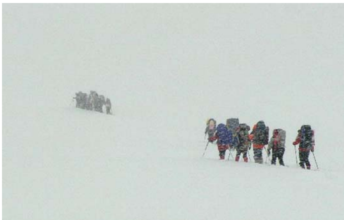
A csapat a ködbe vész

Duruzsol végre a főző, szorgalmasan kanzalazom a havat a sátorajtájából az edénybe. Ké-