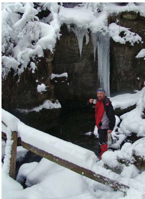
A kék Iza forrásánál