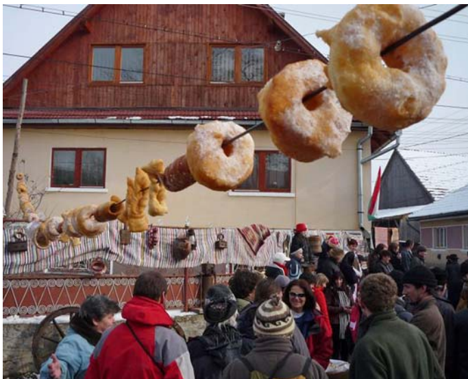
Farsang temetés Csíkban