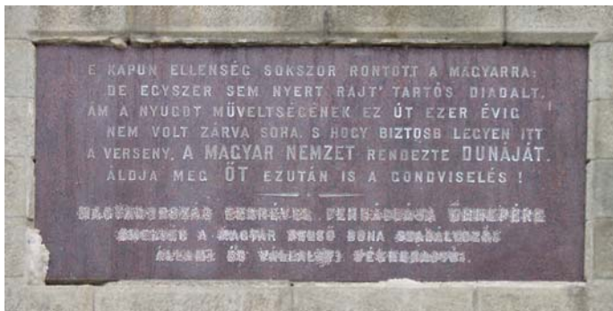
Magyar nyelvű emléktábla egy Duna parti ház udvarán

Habsburg Ágnes özvegy királyné kolostori elttartása címén. 1323 után már a pozsonyi királyi ispán felügyelete alatt állt. 1386 és 1389 között a cseh örgrófok zálogát képezte. Rövidesen az örökké pénzsűkében álló Zsigmond király az osztrák Lessel Hering bárónak adta zálogba 8 ezer forintért a dévényi várbirtokot, akitől 1414-ben Garai Miklós nádorispán a saját költségén kiváltotta az osztrák nagyúrtól. Miután az uralkodó sógorának számító nagyúr örök birtokul is megszerezte az erősséget, jelentős építkezések kezdődtek el, aminek során megépült a Középső vár és benne a Garai palota. 1444 előtt III. Frigyes német király serege más határ menti magyar várakkal együtt megszállta Dévényt is. Az osztrákok uralták az 1450-es békekötésig, amikor is visszakapta a jogos birtokosa. Miután 1481-ben fiúörökös hátrahagyása nélkül meghalt Garai Jób báró, a