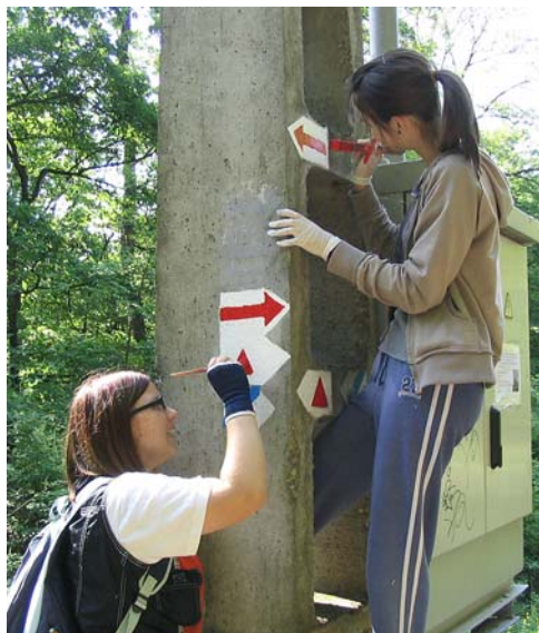
Festés Várkút előtt

Szerencsére egyesületünkben vannak tetterre kész fiatalok, akik meg is valósítják a nagy kárpátos elődök hitvallását – miszerint az ember azért járja az erdőt, hogy a köz érdekében maradandó természetjáró létesítményeket hozzon létre vagy újítsen fel – így a munka az iskolai tavaszi szünetben el is kezdődhetett. Az útvonalak nagyobb része Eger környéki, forgalmas jelzett út, melyet több teljesítménytúra is használ, így nagy gondot fordítottunk a minőségi munkára. Német időjárásálló festékekkel alapoztunk, melynek garantált ideje 10 év (a 2006-ban felújított Országos Kék Túra útvonal még mindig olyan, mintha 1 hónapja festettük volna). Június elejére az összes alapozás és a festés nagy része megtörtént, ekkor jött a TEDOT, emiatt a munkát július 20-án, a Messzelátó alján fejeztük be. A projekt 15 munkanapot vett igénybe, melynek során 58 km utat újítottunk fel.