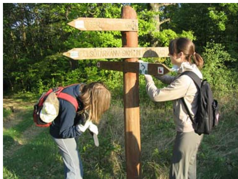
Völgyfőház oszlop tisztítása