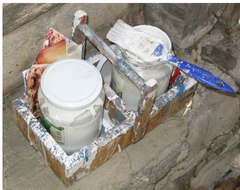
A festékhordó szett

A munkavégzés anyagi feltételeit a Heves Megyei Természetbarát Szövetség pályázat útján biztosította.