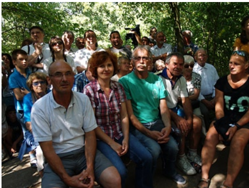
A zászlóbontó ünnepi rendezvény soraiban az MKE képviselői: