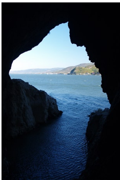
A Duna Belgrádtól – Dunatölgyesig