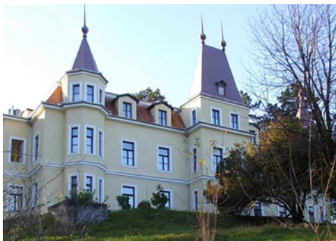
Prohászka Ottokár Élet Háza, Csobánka

Prohászka Ottokár 1915-ben tett felhívására három évvel később a csobánkai Margitligeten az egykori Martin idegszánatórium épületének felújításával jött létre az első magyarországi hadiárva ház. Egyszerre hatvan-nyolcvan kisleány nevelkedett az általa alapított Szociális Missziótársulat otthonában, a társulat nővéreinek otalma alatt. Ha tehetta a püspök úr, rengeteg időt töltött – ahogy ő nevezte az otthonban élő gyerekeket – a „nefelejcskék” között. A hadiárvaházat Prohászka Ottokár hatvanadik születésnapján (1918. október 10-én) nyitották meg.