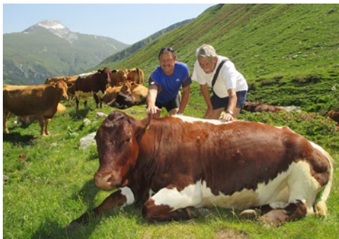
Tehéncsorda a forrás környékén