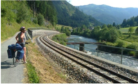
Biciklis út a Murával és a kisvasúttal