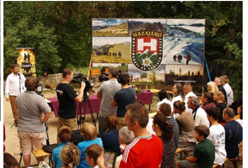
A zászlóbontó ünnepi rendezvény népes hallgatóságának részlete