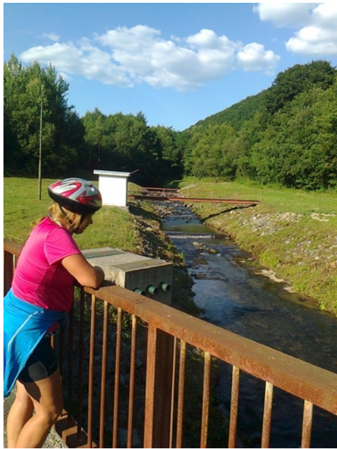
A növekvő Ipoly