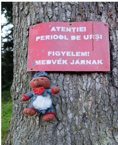
Medve veszélyre figyelmeztetés