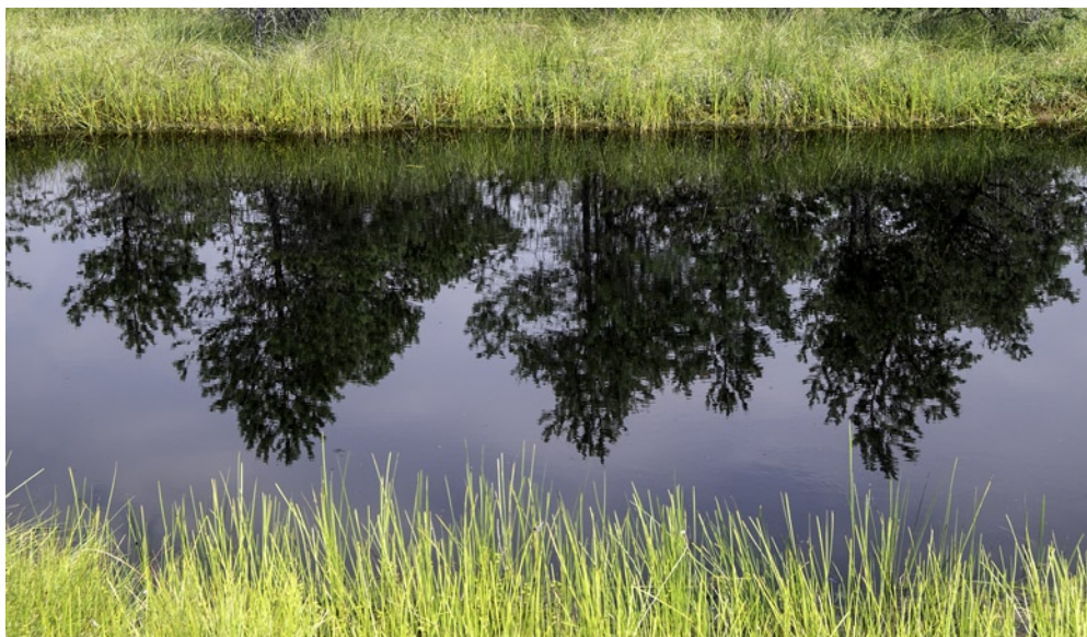
SVENT ANNA-TÓ – MOHOS-TŐZGLÁP gyalogtúrán, tőzeglápról készült felvétel

EKE tagja. A táborban legtöbben, a házigazdák mellett, a Magyarországi Kárpát Egyesület és az EKE Gyergyó turistái ütöttek sátrat, egyformán hatvanan voltak. Az EKE Háromszék részéről harmincan jelentkeztek, a braszói turistákat pedig tizenötön képviseltük.