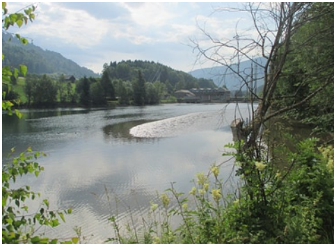
Mura folyót erős áramlatok jellemzik