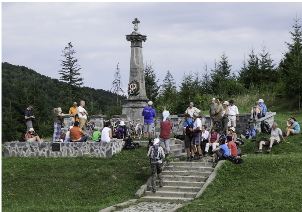
Kirándulánk a nyerges-tetői 1849. aug. 1-én lezajlott csata emlékművénél