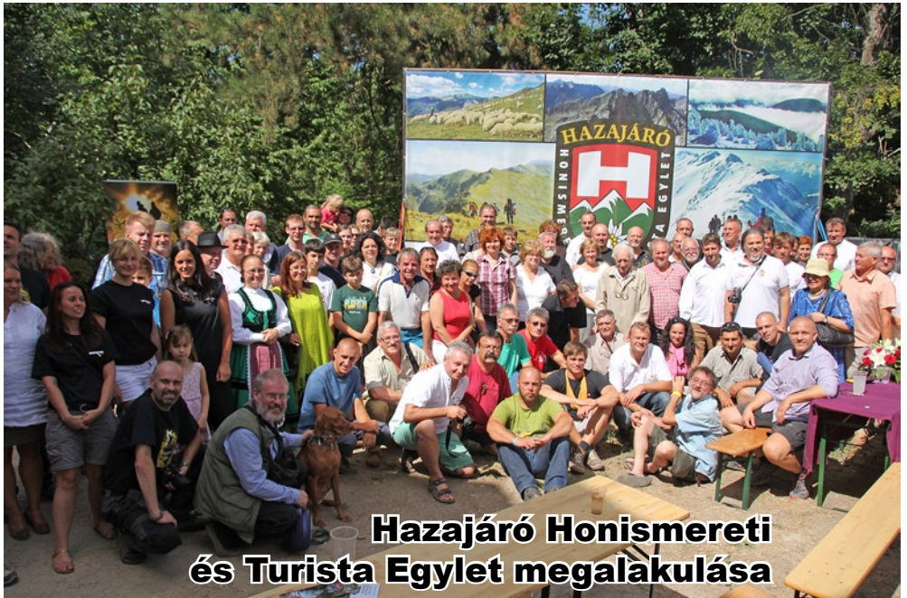
Hazajáró Honismereti és Turista Egylet megalakulása