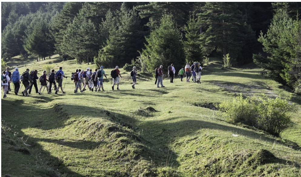
CSÍKSZENTGYÖRGYI BOLDOGASSZONY KÁPOLNA – NYERGES-TETŐ gyalogtúra

bor a Kárpát-medence legnagyobb turistarendezvénye. A táborba 1245-ön jelentkeztek be, Magyarországról több mint négyszázan érkeztek. Legmesszebből Angliából jött négy turista. A tábori tevékenységet 105 főnyi szervező csapat vezette, irányította, amiből 91 volt a Csíkszéki