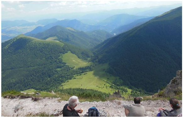
Kilátás a Nagy-Rozsutecről