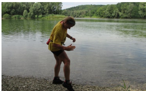
Szúnyogvadászat a Mura-Dráva találkozásánál