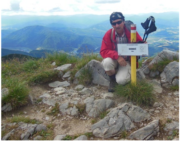
A Kis-Fáttra főgerincén (Homové 1636 m)