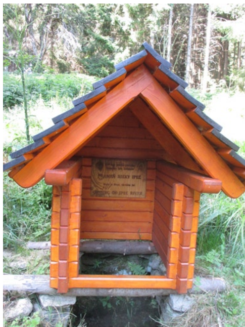
Az Ipoly forrása