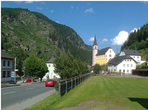
Mura menti táj