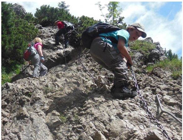
Lejövet a Kis-Rozsutecről