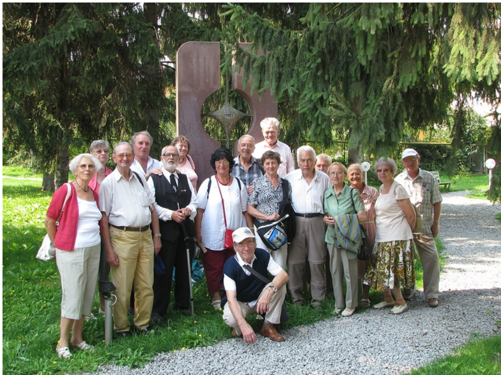
Csütörtöki sétálóink immáron kimozdultak szeretett városukból, Brassóból. Sepsiszentgyörgyre látogattak. A csoportkép az 56-os politikai foglyok emlékművénél készült (Fotó: Erdély András)

„A csütörtöki sétát én trom az Erdélyi Kárpát-Egyesület Brassó égisze alatt, ez is EKE tevékenység. Írásaim már több mint öt éve rendszeresen megjelennek a Brassói Lapokban. Itt népszerű lett. Már az is jó, hogy az emberek otthonról kimozdulnak és eljönnek a Cenk alá. Sétáló listánk egyre gyarapodik, eddig 336-on inatkoztak fel. A séta mellett örömteli, hogy párkapcsolatok alakultak ki az özvegyek között, barátságok fonódtak. Séta után a közeli kerthelyiségben még másfél-két óra tereferé, fagyalt, sör, tea mellett, télen pedig vendéglőben. Ezeken a helyeken szájharmonikázás kíséretében nótázunk, közös névnapokat, születésnapokat tartunk. A Salamonkö szikla szorosában már a harmadik piknikünket tartottuk. Ilyenkor három-négy tüzhelyen sült a flekken, mititej stb. Ezt minden hónapra beterveztük, télire is, mert olyan jól érezte magát a társaság. Legutóbb 43-an voltunk, zengett a völgy a nótázásunktól. Elhatároztuk, októberben közös bográcsozás lesz, mert eddig mindenki, amit hozott azt sütötte.”