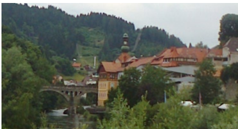
Murau látképe a köhíddal

menni és végül 15 km-re a Swarzee-nél, túránk során a legdrágább kempingben sikerült letáboroznunk. A kemping drága, koszos, zajos a kényelmi feltételeket össze sem lehetett hasonlítani az előzőekkel. A kemping tele van nyuszikkal, igaz ez Ausztriában megszokott jelenség, több kempingben is találkoztunk velük.