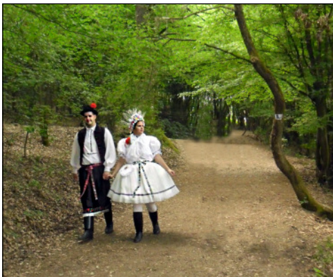
Hollókői ifjú pár