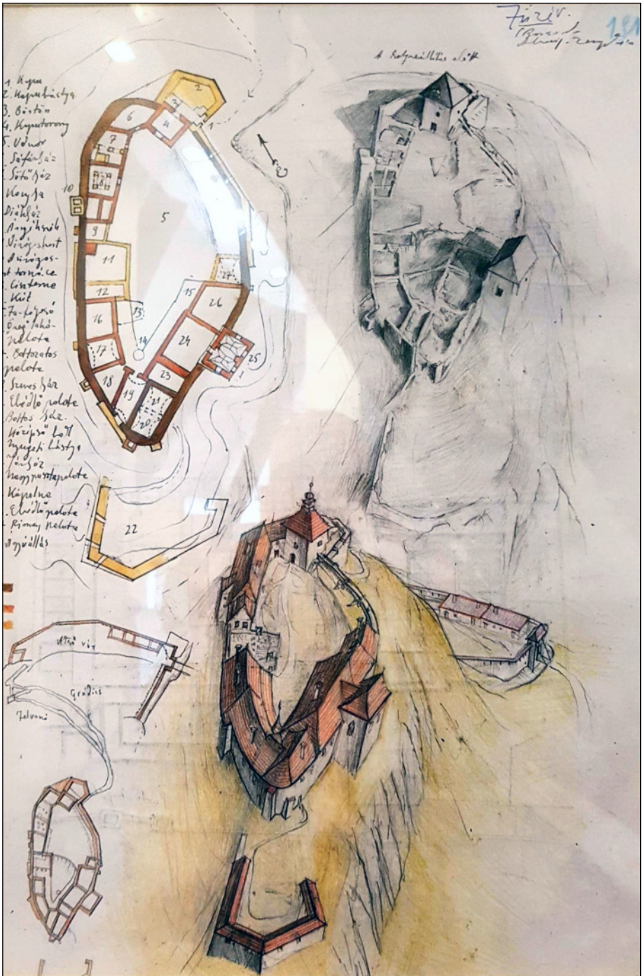
A Füzeri vár rajza a helyreállítás előtt és után (a várban kiállított kép reprodukciója)