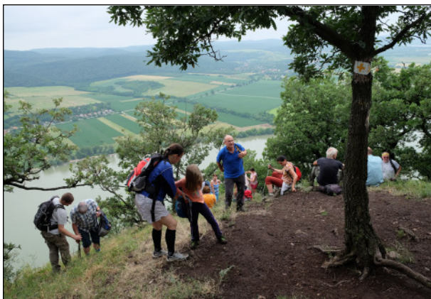
Ahol lehetett, kerestük a Dunára néző helyeket