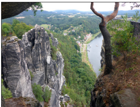
Az apadó Elba felülről

megint homokkő sziklák” életérzés. Úgyhogy vesszük is az irányt le a hegyről, a kényelmesebb völgybe, vissza a kompra. Még lenne egy jópófa, kertbe kiépített modellvasút, de a megérkező zivatar mindenkit bekerget buszba. Nagyon kell már az eső, hiszen akkora a folyó, hogy látszik a meder a partokhoz közel és a nagyobb méretű halmak kilátszik a hátúszója. A nap krónikájához még az tartozik hozzá, hogy a szállásra érkezésünk után 10 perccel nagy baleset történt és teljesen lezárták az utat. Megint szerencsénk volt!