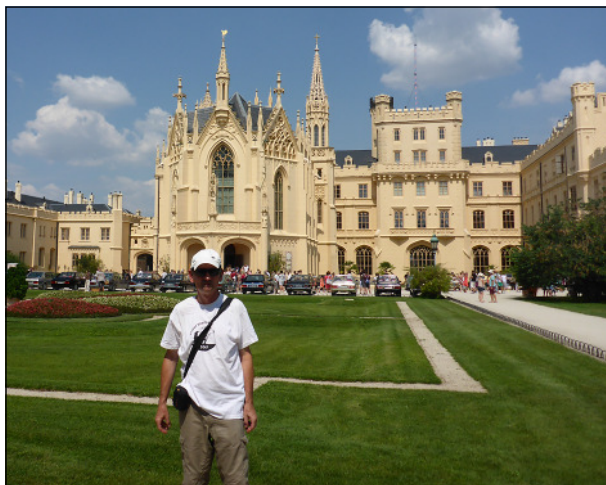
A szerző a lednicei kastély parkjában

Egri egyesületünk ezúttal a Prágától északra, északkeletre eső hegycsoportokat célozta meg, melyet Cseh-Svájc és Cseh Paradicsom néven emlegetnek. A kiválasztásban nagy szerepet játszott egyesületi elnökünk Rumcájsz meséi iránti rajongása. A hírhedt zsvány a Jicin környéki erdőkből kijárva bosszantotta a város idegen urait.