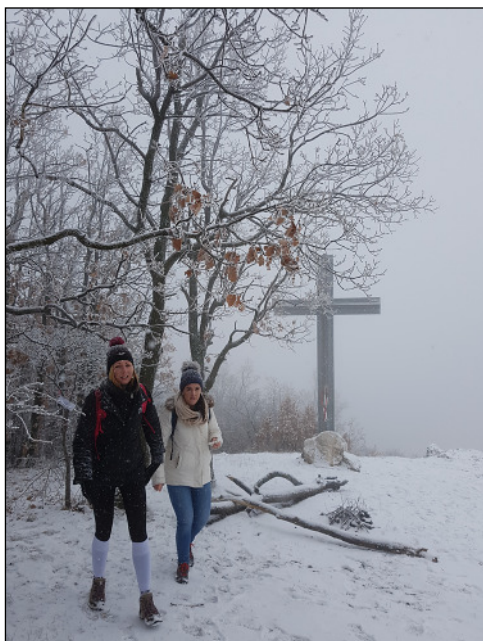
A Kárpát Egyesület, Eger évkezdő túrája elhaladt a Kereszt mellett. A szép kilátás „behavazott”