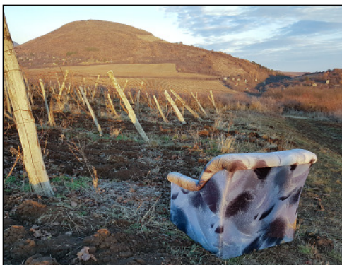
Eger város határában lévő szőlők, szemben a Nagy-Eged