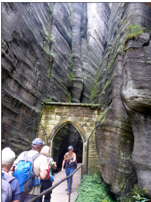
A gótikus kapu

park bejáratát és 100 cseh korona (kb. 1400 Ft) leszurkolása után bebocsájtást nyertünk. Egy elképesztő séta vette kezdetét, ez volt a „hű... azt a” időszaka. Amerre az ösvény haladt, kétoldalt elképesztő, toronyház méretű homokkő sziklák emelkedtek, a fák eltörpültek közöttük. Teljes sziklaváros zezugos ösvényekkel. Több szikla magassága meghaladja a 100 métert. Itt ott hegymászók igyekeztek fel kötélbiztosítással.