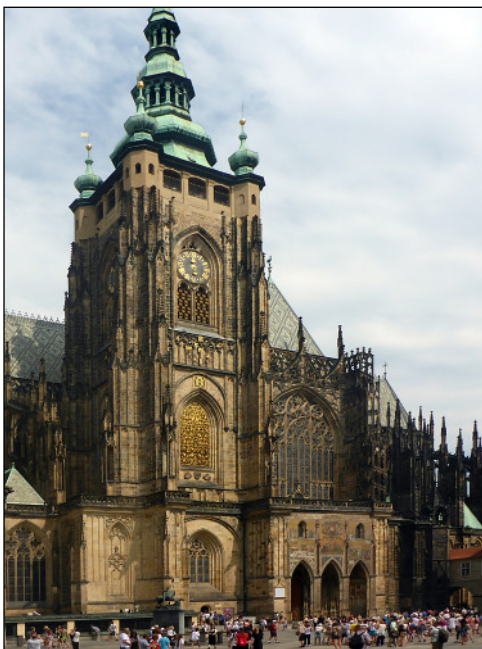
Prága, Szt. Vitus székesegyház

gépkocsi karaván kíséretében. Hrinsko település üdülő övezetében, egy jól kinéző, ámde induláskor nem igénybe vehető étterem parkolójából kezdődik a túra. Enyhe emelkedők után Pálinkás Lacival az élre törünk és szintben sokáig futó jó 5 km-es szakasz végén végre egy elágazás. Innen már csak 20 percnyi emelkedő van hátra, és látjuk is a monumentális sziklakaput. Alatta, mellette étterem, az étterem mögött beléptető kapu és pénztár, 3 euro. Itt már érződik