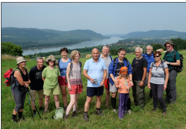
Háttérben a Dunával a Napraforgó tanösvényen

Innen már Zebegény irányába kutyagoltunk, de még egy kis kitérővel meglátogattuk az Ernő-forrást. A frissítő víz jótékony hatásának volt köszönhető, hogy nyöszörgés nélkül felmentünk a zebegényi kálváriadombra. Itt aztán lehetett nézelődni: Trianoni emlékmű, Kálvária-kápolna, Kós Károly-kilátó, ahonnan a délután ötórai nap fényében ismételtlen megcsodáltuk a Dunát. Aki sietett haza, a közeli vasútállomás felé vette az irányt, mi pedig a községen áthaladva a Mályi-Victor lakba mentünk. Mérésem szerint a túra 14 km hosszú, szintemelkedése pedig 572 m volt.