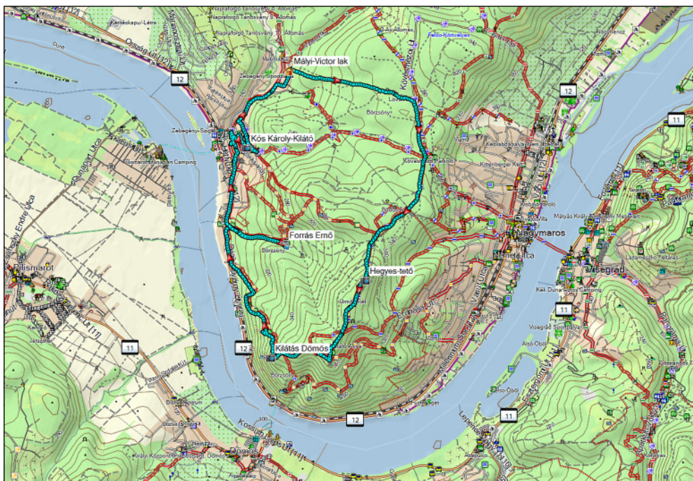
Dunakanyar, a Börzsöny zebegényi környezete, valamint a szombati túra útvonala