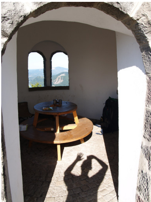
Hegyes-tetőn lévő Julianus barát torony letről, bentől. Tetejéről pedig a csodás kilátás