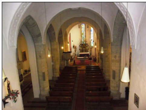
Mátraverebély gótikus templom belseje

A kék túra a Cserhátba érve több helyen is új nyomvonalon halad, útjába esik Szentkút és a mátraverebélyi gótikus műemlék-templom is, amit szakszerű vezetéssel meg is tekintettünk. A templom híres halottja, Verebi Péter erdélyi vajda egy harci sebesülést követően lemondott a vajdaságról, és visszavonult az itteni birtokára. A közeli Szentkút víztől hamarosan meggyógyult, és hálából felújíttatta a templomot, itt látható a sírja is. Erdélyi vajdasága idején felvette a Hunyadi nevet, és ezen az ismert néven lett a törökverő Hunyadi János édesapja. Halála után a még kiskorú János a Szibinyáni család gondozásába került, így ismerik a szerbek Szibinyáni Janko néven.