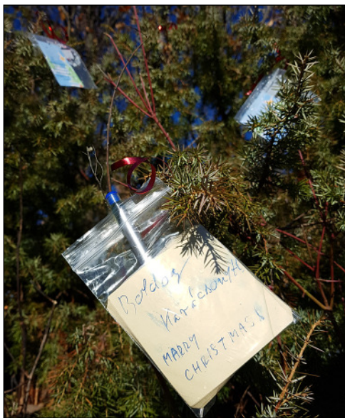
Az intelligens kirándulók üzenetei. A névtelen-ség ellenére, nincs benne trágár szöveg

Két nap múlva ismételen megjártam a „keresztutam”. A kisborókán már csak kettő táblácska fityegett, a harmadik helyére, pontosabban annak tasakjába egy toll és üres papírok kerültek. Már az első lapon, két nyelven kézírás-sal rögzített ünnepi jókívánságokat olvastam.