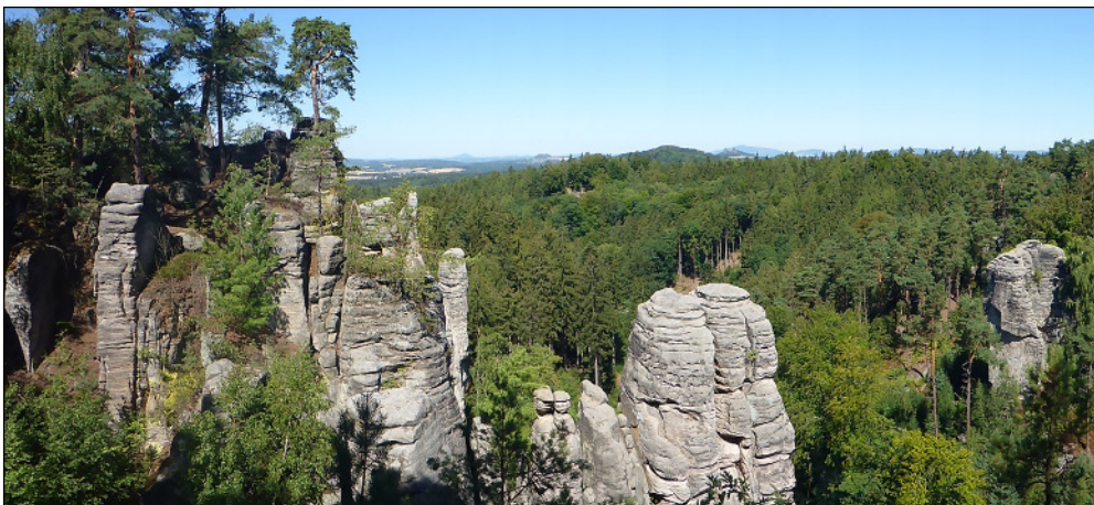
Kilátópont a Cseh Paradicsomban