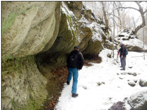
Szentkút, Szent László-hasadék