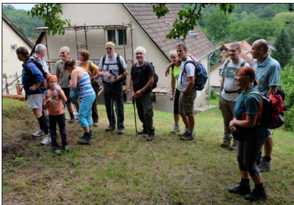
A felújítás folyamatában lévő ház állványai alatt átbújva indulásra készen a Hegyes-tető irányába

Most, számomra a legfőbb érdekesség – hogyan is nevezzem – a Mályi-Victor villa . Aminek utcája természetesen az Északi-középhegység nyugati szélének szépséges hegységéről, a Börzsönyről van elnevezve. Ez a Börzsöny utcai családi ház közvetlen kijáráttal rendelkezik a tőle Észak-Északkeletre elterülő Börzsöny hegységbe. Talán ez lehetett a házikó kiválasztásának egyik szempontja. A másik pedig, a teraszról csodaszép a kilátás a Sárkánydombra, kicsit távolabb a Pilisre. Na és Duna közelsége. Természetesen a tervezett túráink bejárásakor fő szempont volt a Duna láthatósága.