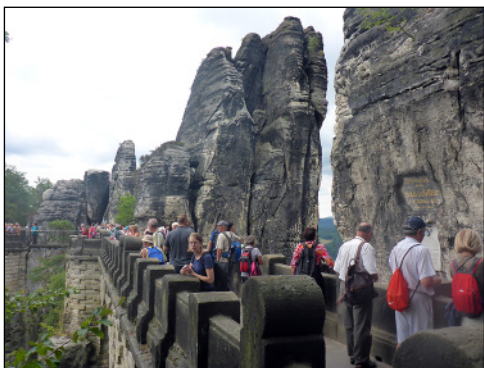
A Bastei kőhid