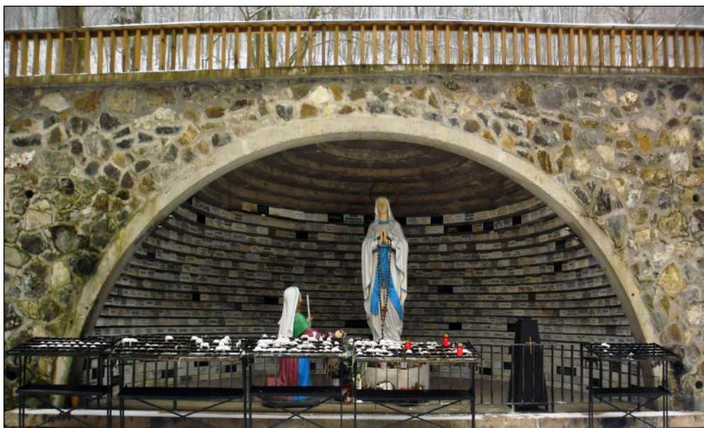
Szentkúti Szűz Mária és a hálaadó táblák sokasága