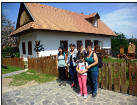
Hollókő népművészeti értékeit csodáltuk