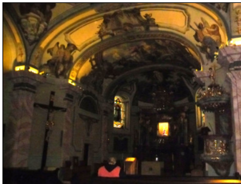
Szentkúti Nagybaldogasszony templom kívül-belül