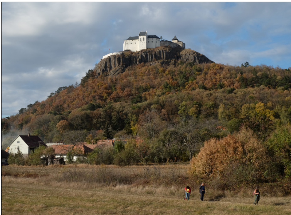
A Füzeri vár látképe