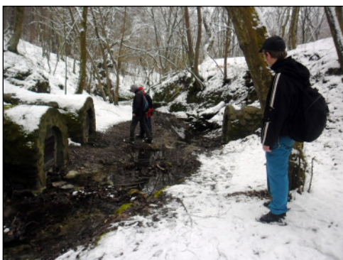
Szentkút, Szent Imre, Szent László és a Szent István források