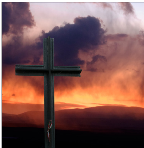
Szent István-Kereszt. Helye a Nagy-Eged város felőli oldalán van. Talapzatán a felirat: Szent István király 1004-ben alapította az egri püspökséget

A Kárpát Egyesület, Eger legújabb túramozgalmának érintési helye a Nagy-Eged csúcsa. Ez azt jelenti, hogy aki egy év alatt tízszer arra gyalogol és azt igazolható módon megőrökíti, akkor jogosult lehet a Nagy-Eged Túra Kupa – ami egyedi kerámia boros kupa – megvásárlására. Durván fogalmaztam, mert részvételi díj van, ami viszont a kupa ára. Erről részleteket az egyesület honlapján – www.karpategyesuleteger.hu – talál az ez iránt érdeklődő.