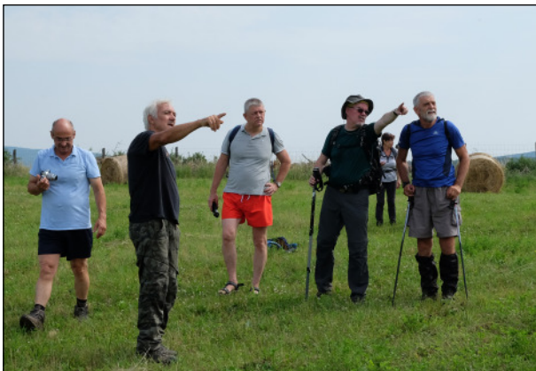
Valami érdekes a Napraforgó tanösvényen

Innen már Zebegény irányába kutyagoltunk, de még egy kis kitérővel meglátogattuk az Ernő-forrást. A frissítő víz jótékony hatásának volt köszönhető, hogy nyöszörgés nélkül felmentünk a zebegényi kálváriadombra. Itt aztán lehetett nézelődni: Trianoni emlékmű, Kálvária-kápolna, Kós Károly-kilátó, ahonnan a délután ötórai nap fényében ismételtlen megcsodáltuk a Dunát. Aki sietett haza, a közeli vasútállomás felé vette az irányt, mi pedig a községen áthaladva a Mályi-Victor lakba mentünk. Mérésem szerint a túra 14 km hosszú, szintemelkedése pedig 572 m volt.