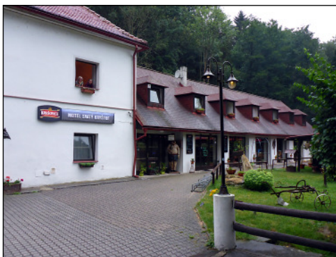
Szállásunk az étteremmel

park bejáratát és 100 cseh korona (kb. 1400 Ft) leszurkolása után bebocsájtást nyertünk. Egy elképesztő séta vette kezdetét, ez volt a „hű... azt a” időszaka. Amerre az ösvény haladt, kétoldalt elképesztő, toronyház méretű homokkő sziklák emelkedtek, a fák eltörpültek közöttük. Teljes sziklaváros zezugos ösvényekkel. Több szikla magassága meghaladja a 100 métert. Itt ott hegymászók igyekeztek fel kötélbiztosítással.