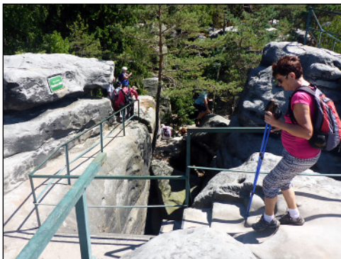
Az utak mindenütt jól kiépítettek

Ha Csehországban túrázunk, nem lehet kihagyni a német határhoz közel eső sziklakaput, a Pravčicka Brana-t. Amolyan Berva-völgy felsőbb részén futó út szélességű aszfaltcsíkon haladunk,