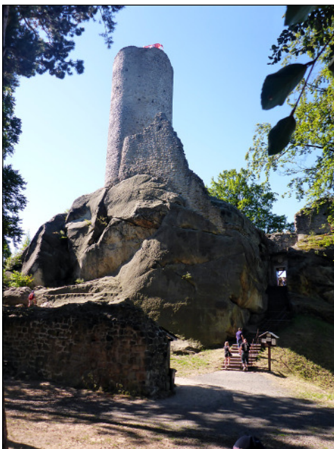
Frydstein, a vár öregtornya

érte el várost, véget vetve a kánikulának. A világ minden tájáról összeverődött tömeg persze bőrig ázott és csoportunk nagyobb része is. Mi hárman egy híd alatt vészeltük át a vihart.