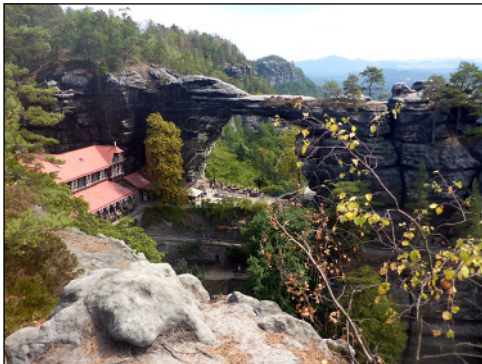
A híres sziklakapu

gépkocsi karaván kíséretében. Hrinsko település üdülő övezetében, egy jól kinéző, ámde induláskor nem igénybe vehető étterem parkolójából kezdődik a túra. Enyhe emelkedők után Pálinkás Lacival az élre törünk és szintben sokáig futó jó 5 km-es szakasz végén végre egy elágazás. Innen már csak 20 percnyi emelkedő van hátra, és látjuk is a monumentális sziklakaput. Alatta, mellette étterem, az étterem mögött beléptető kapu és pénztár, 3 euro. Itt már érződik