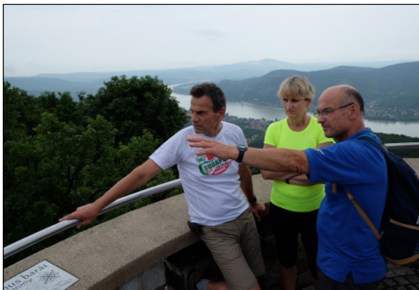
Hegyes-tetőn a Julianus barát toronyból nézelődtünk

Szombatra körtúra volt kigondolva, a börzsönyi Hegyes-tető legfőbb célponttal. Persze egy kis kerülővel értük el, hogy legyen a lábunkban néhány kilométer. Így jutottunk el a Törökmezői tanösvény „6. Madárdalos Börzsönyi Erdők” ismertető táblájához. Majd a tanösvényen tovább a Köves-mező irányába haladva a Virágos-tér érintésével elértük a Hegyes-tető 482 m magas pontját. Mondanom sem kell, azonnal felmentünk a Julianus barát torony tetejére. A tábla szerint a mutató és időt álló kilátót 1939-ben építette megalakulásuk negyedszázados emlékére – a Magyar Turista Szövetség támogatásával – az „Encián turisták 1914” elnevezésű szervezet. Innen csodálatos a kilátás a Duna két kanyarulatára. Hosszasan nézelődtünk, majd továbbmenve újabb Duna-néző helyet kerestünk. A Dobozi-orom 315 m magas pontja közel sem volt olyan látványos, mint a hegyes-tetői, de annak is nagyon örültünk.