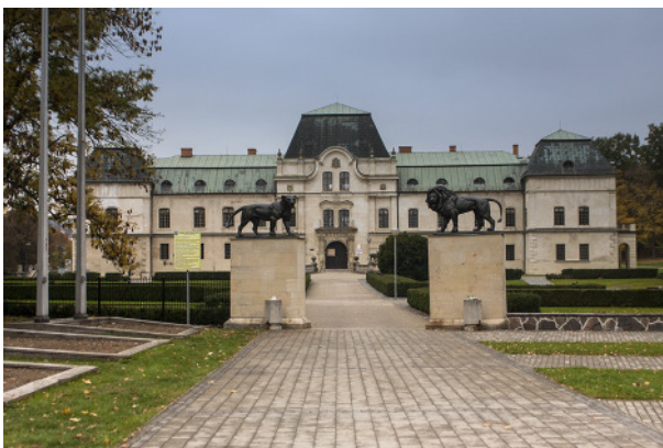
Homonna: Andrassy-Drugeth kastély főbejárat, 2013.

A város komoly károkat szenvedett a második világháború idején, az arculatát a szocreál építészet elemei jellemzik. A települést és környékét Károly Róbert a Drugeth családnak