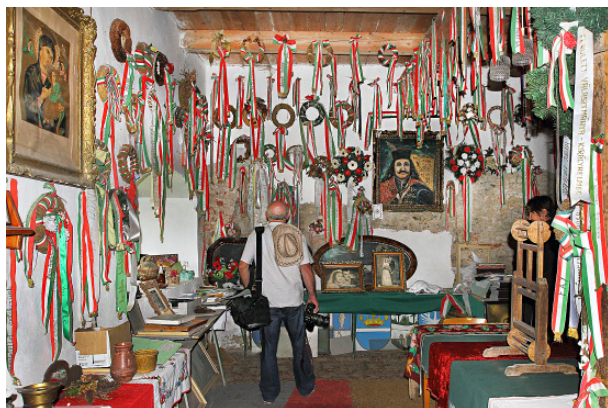
A megemlékezések terme