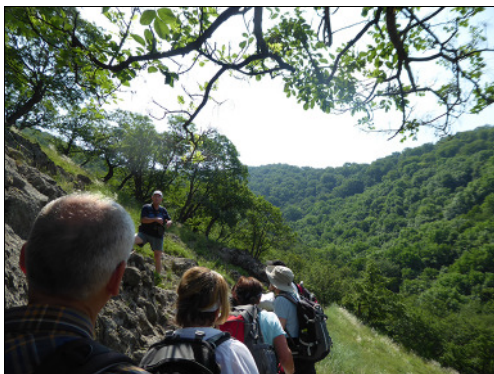
Visegrád–Dömös (Visegrádi-hegység) utunkon a Spartacus ösvényen haladtunk