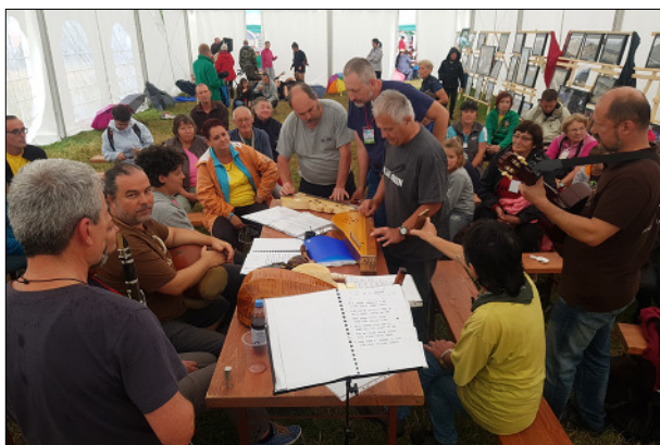
Ének és hangszerbemutató a tábori nagysátorban

a negyven állatot számláló vaddisznó farmjára vitt el az agilis polgármester, aki kilenc testvérével egyetértésben sokat tesz a község fejlesztéséért. A farmon kedvtelve szemléltük a párnapos csíkos malackákat.