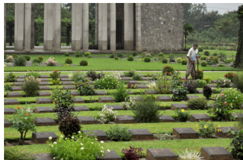
Bago az ősi Mon Királyság fővárosa volt. Bago, Angol katonai temető