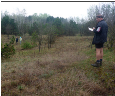
A szerkesztett ellenőrző pontnál