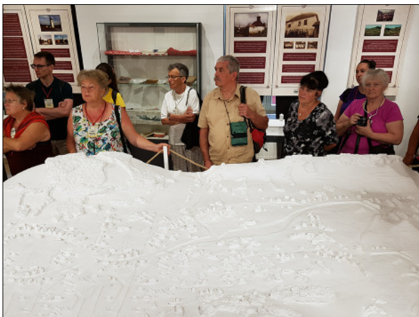
Egykor volt Bözödűfalu makettje Erdőszentgyörgyön a Rhédey-kastélymúzeumban