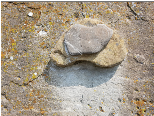
Nagy- és Kismagyarország vízformálta kővekből készült. A kőrispataki szalmakalap múzeum udvarán látható