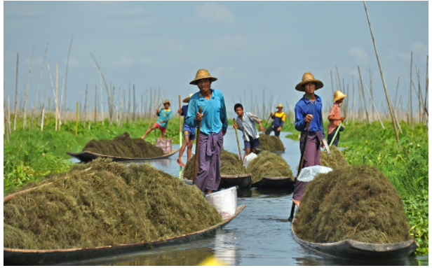
Növénytermesztés, halászat az Inle-tavon Kertépítés alapanyagai és a kert elkészítése. Paradicsom szüret. Halászat