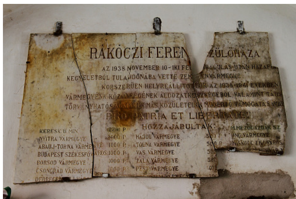
Emléktábla a múltból