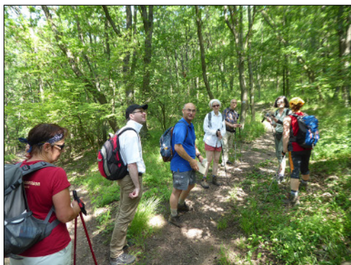
Ipolydamásd–Márianosztra útvonalon (Dél-Börzsöny) az árnyat adó fák alatt pihentünk