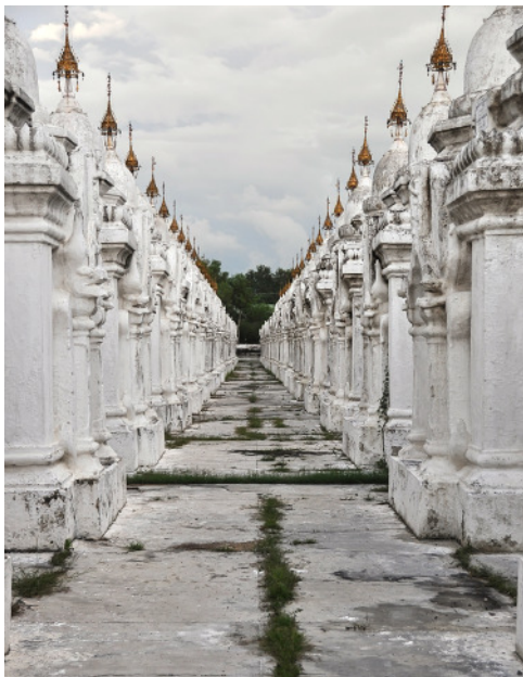
Mandalay, Könyvek stupái

Mandalay a brit gyarmatosításig volt a főváros, művészeti központként is működött. Emellett a térség legjobb oktatási központja volt.