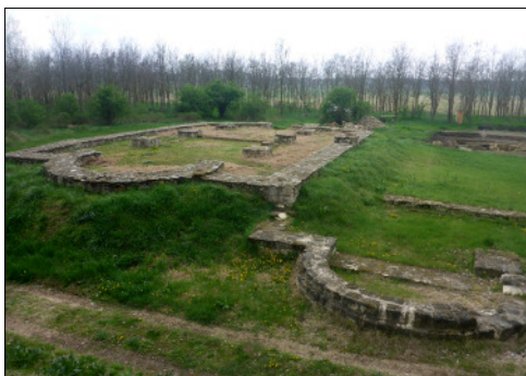
Felsőmonostori romok Bugac közelében

A siker elkönnyvelését követően megtaláljuk a gáztelepet, ahol letérünk a Felsőmonostori templom romjai felé. 2010-ben megindított feltárás kimutatta, hogy egy több négyzetkilométeres kiterjedésű, kőházakból álló, virágzó település állt az Árpád-korban, melynek középpontjában egy bazilika és egy monostor helyezkedett el. Ez utóbbiak romjai között különösen jelentős leleteket tártak fel, köztük egy 1180 és 1190 közötti keletkezésűnek datált ereklyetartóval, amely eredetileg talán Szent Péter ereklyéjét őrizhette; értéke ez esetben szinte felbecsülhetetlen értékű lehetett abban a korban. Azt lehet a leletek alapján megállapítani, hogy élt itt egy nagy népesség 1050 és 1130 között, amely magyar keresztény lakosság volt. 1130 és 1150 között épült egy kis kolostor és egy hatalmas bazilika. Utóbbi háromhajós, félköríves szentélyzáródással volt ellátva. Mindezt 1200 körül