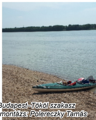
Budapest–Tököl szakasz Fotómontázs: Polereczky Tamás