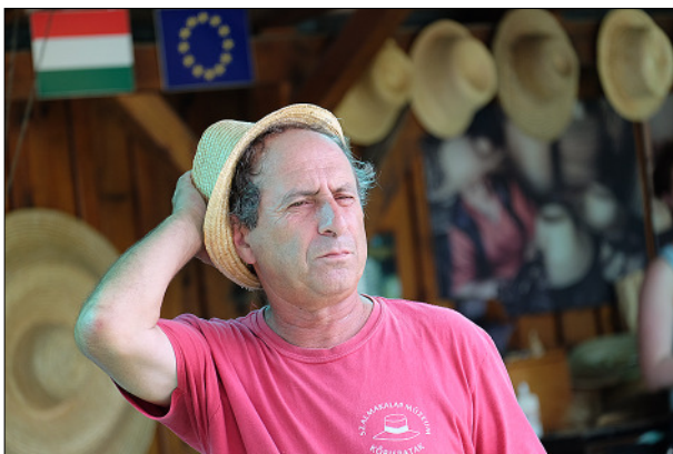
Szalmakalap bemutató Kőrispatakon