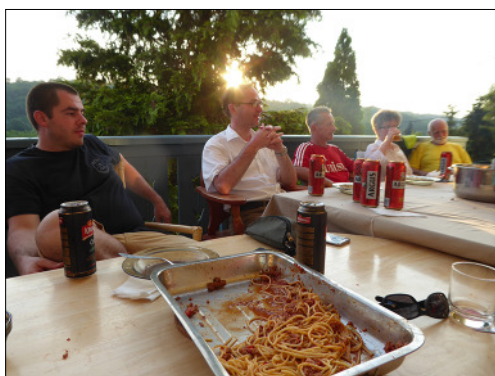
A vacsorák és reggelik „terülj-terülj asztalkám”-ja mellett vidáman beszélgettünk