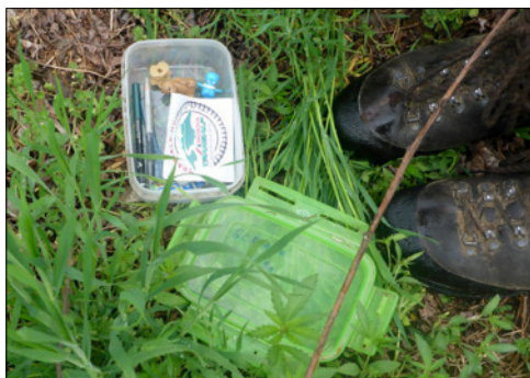
A geoláda tartalma