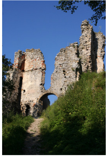
Barkói várromok részlet 2.

Várát a Kaplony nemzetség nagymihályi ága építette a 13. század végén. A vár 1317-ben a Drugethek birtokába került. A vár alatt ütközött meg Mátyás király Kázmér lengyel királlyal, 1466-ban. I. Rákóczi György serege rombolta le 1644-ben, azóta rom, csak egyes falrészek és néhány boltozat maradt fenn. A