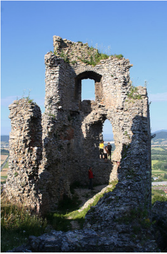
Barkói várromok részlet 1.

Barkó (Brekov) község a Homonnai járásában. Őrmezőt elhagyva (Strážske) Homonna felé haladva a várom messziről föltűnik.