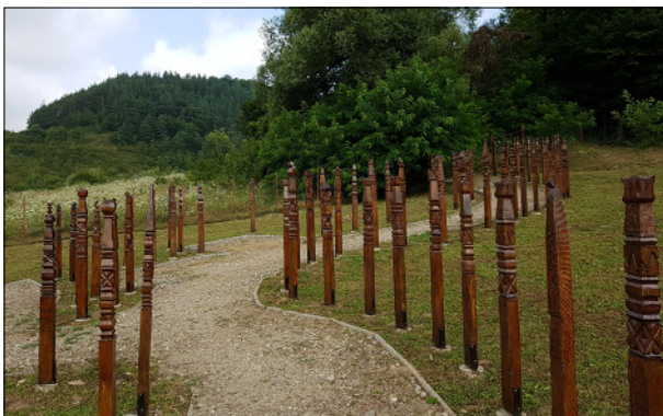
Kopjafa park Bözödűfalu emlékhelyen