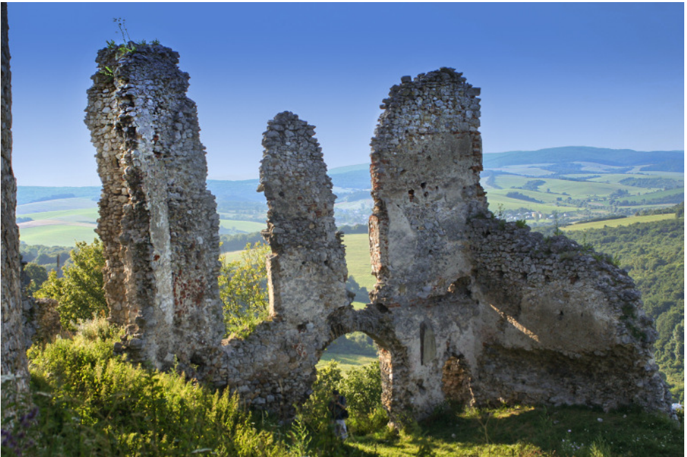
Barkói várromok részlet 3.

vár a mai napig őrzi háromemeletes magasságát, láthatóak a kapuk, az átjárók is, melyek valószínűleg felvonóhíddal voltak összekötve. Megközelítése: GPS: 48°54'08.6"N 21°49'55.9"E . Homonna, vagy Őrmező felől érkezve a 74. sz. úton, a temető melletti parkolóig menjünk, majd egy enyhén emelkedő úton, kb. 20 perc alatt elérhetjük a romokat.