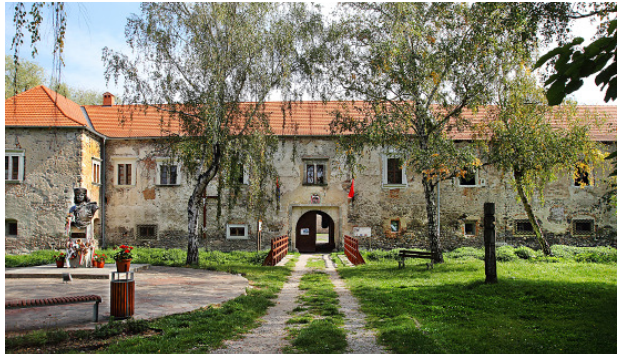
II. Rákóczi Ferenc szülőháza Borsiban (Borsa)

Néhány évvel korábban, a Heves Megyei Fotóklub részéről, egy szlovákiai túránk során megálltunk Borsi nevű településen, amely Szlovákiában található, Sátoraljaújhelytől 3 km-re. Kíváncsian kerestük fel II. Rákóczi Ferenc szülőhelyét, vajon milyen állapotban van és milyen eddig nem látott érdekességgel találkozunk.