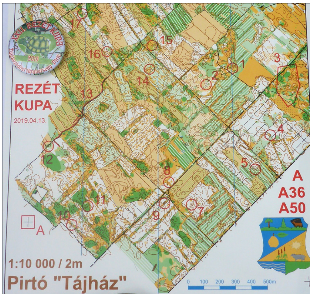
A versenytérkép részlete a verseny kitűzőjével