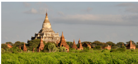
Bagan a Pagan Királyság fővárosa volt

Bagan megalapítása és a buddhizmus államvallássá nyilvánítása egyidejű a Szent Istváni államalapítással. Még egy párhuzam: a 13. században érte el a mongol hódítás keletet és nyugatot. Burmában hosszú visszaesés és a hatalom szétforgácsolódása következett. A múltban 13 ezer pagoda és templom épült Baganban, mára ebből 2500 maradt.