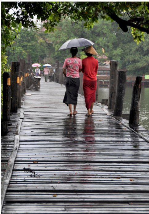
Amarapura, a híres U-Bein teakfa híd. Esőben is látványos

Amarapura 1782-1852-ig volt főváros. Híres 1,2 km-es teakfa gyaloghídját ma is megcsodálják az utazók. Mára a város a növekedés következtében Mandalay része lett.