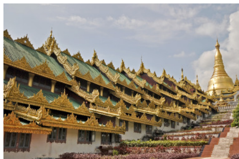
Yangon, Shwedagon Pagoda déli bejárata

Régi fővárosainak mindegyikéről lehetne egy-egy külön kiállítást készíteni.