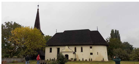
Nyírmihálydi középkori temploma

Először Nyírmihálydi középkori temploma lepett meg: