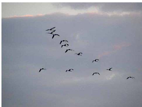
Darvak (felénk közeledve mindig irányt változtattak)