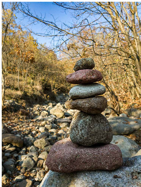
„Kőördög” az Ördögvályúban