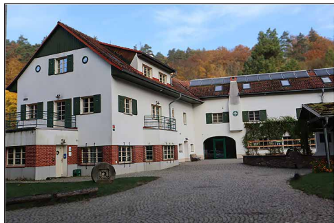
Az alapokig visszabontott gazdasági épület újjáépítve, a mostani cserkészpalánták csehországi fellegvára