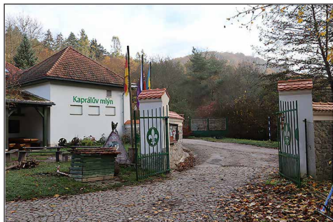
Kaprálov mlyn kapuja a jó emberek előtt mindig nyitva áll