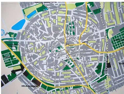
Hajdúböszörmény – alaprajz

Hajdúböszörmény alaprajza nagyon tanulságos. A magyarázathoz felnagyítottam. Jól látható a város centrális elrendezése. A központból egyenesen haladnak kifelé a sugárutak. Ezt az alaprajzot nyilván katonai-védelmi szempontok