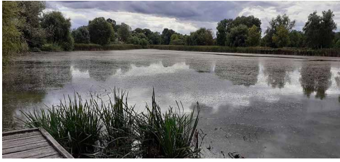
A Vekeri-tó: lehetne jobb a víz minősége! (A kemping egyébként teljesen elhagyatott volt)

Hosszúpályiban egy nagyon kellemes, jól rendezett panzióban szálltunk meg. Másnap reggel innen indulva kerestük fel az álmosdi csatának majdnem a román határon emelt emlékművét: