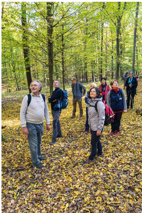
Figyelem a szél játékára, levelek mozgására