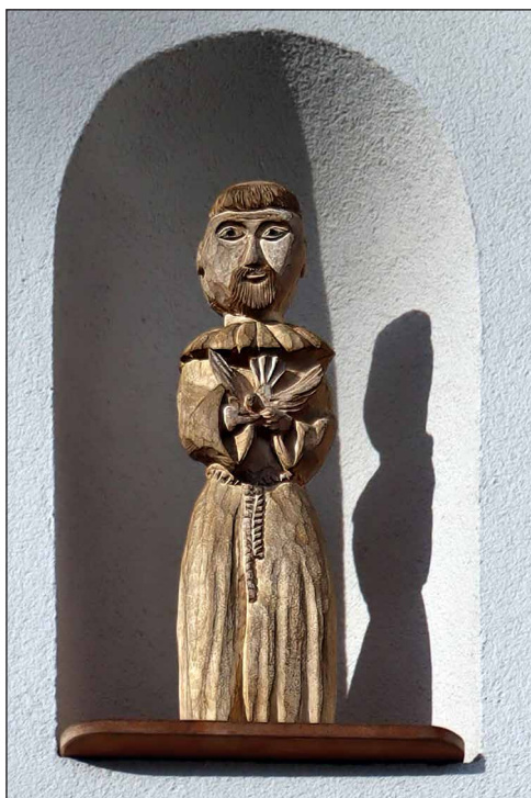
Assisi Szent Ferenc az épület védőszentje