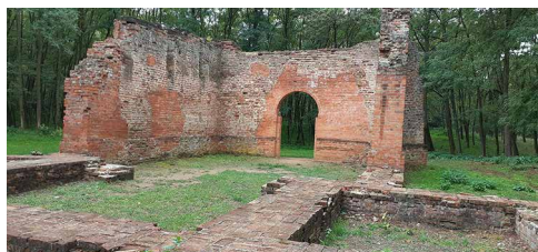
Az egykori Guti falu templomának romja, amely a XVII. században pusztult el

Ezután a Guti erdőben található templomrom következett: