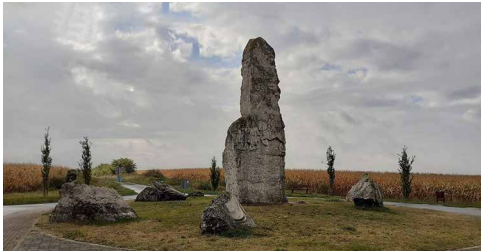
A magyar-román határ Álmosd és Létavértes közelében, a határtól 200-300 méterre van Bocskai álmosdi győzelmének emlékműve

Hosszúpályiban egy nagyon kellemes, jól rendezett panzióban szálltunk meg. Másnap reggel innen indulva kerestük fel az álmosdi csatának majdnem a román határon emelt emlékművét: