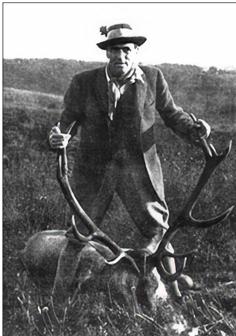
Zsiga bácsi egykoron

Helyét az agancsszár lágy ívelése jelzi. Jól fejlett középage felett háromágú koronát viselt. Ereje teljében lévő, öt-hatéves, ígéret teljes dalia hagyta itt ékessége egyik felét. A koronaágak vastagodásai, hajlásai jelzik, hol fognak a későbbi években újabb ágak előtörni. Mennyit tudna még Széchenyi Zsiga bácsi mesélni róla!