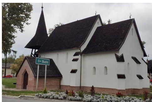
Nyíracsad. Itt is van egy középkori templom – és nem rom

A Guti templomromnál nagy meglepetés ért bennünket. Egy itt elhelyezett táblán olvastuk, hogy a Guti erdő a dámvadak agancsának világrekordja (és nem Gyulajé). Döbbenetes, hiszen csak 1972-ben telepítettek ide dámszarvasokat.