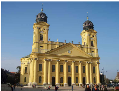
Debrecen – Nagytemplom

Debrecenre bizonyára a legjellemzőbb épület a Református Nagytemplom. Az ország legnagyobb protestáns temploma, amely a „kálvinista Rómának” is nevezett Debrecen központjában 1805 és 1824 között épült fel klasszicista stílusban Péchy Mihály tervei alapján. Helyén már a középkorban is egy templom volt – a gótikus Szent András-templom. A templomban ülésezett 1848-49-ben a magyar országgyűlés. Itt mondták ki a Függetlenségi Nyilatkozatot 1849. április 14-én. Történt itt egy másik történelmi esemény is -, amely már rossz érzéseket is kivált – az Ideiglenes Nemzetgyűlés 1944 decemberében.