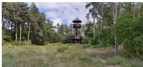
Az első Fancsika-tó kilátójánál