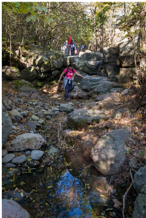
Útkeresés az Ördögvályúban