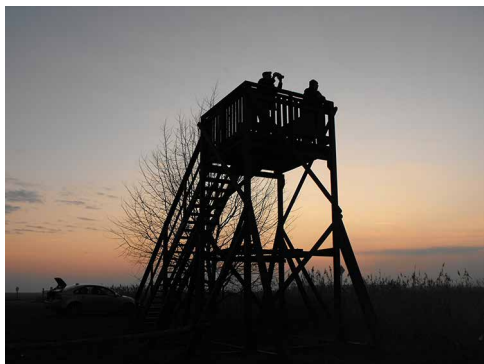
Esti kép a Hortobágyon

A Hortobágy azonban nemcsak Nemzeti Park, hanem történelmi emlékhely is: Rákosi idejében nagyszámú úgynevezett „reakciós” családot telepítettek ki embertelenül és embertelen körülmények közé.