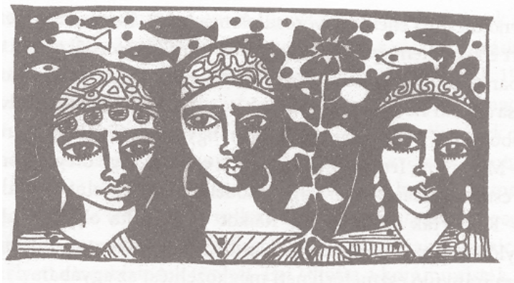
A verseket kísérő illusztrációk Szécsi Magda rajzai