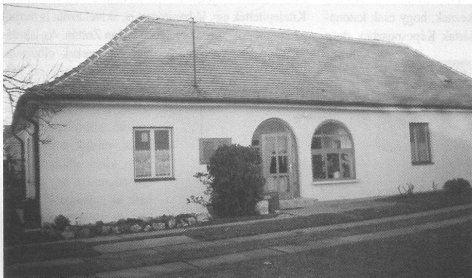
Átalakított ONCSA-ház Kozármislenyben az egykori Horthy telepen (a források Üszögpuszta néven említik) 2005 januárjában

alájuk rendelve a megyei városi, járási és községi szociális titkárok irányították a szociális munkát. Tehát egy új hierarchikusabb, az államnak jobban alárendelt szervezetet építettek ki. A közjóléti szövetkezetek működési területe beszűkült. Új telepítés, ház- vagy földjuttatás már egyáltalán nem szerepel tevékenységi körükben. A Baranyavármegyei Közjóléti Szövetkezet 1946-évi te-