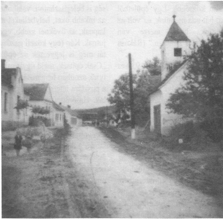
Az elbocsátó falu, a zalai Ortaháza