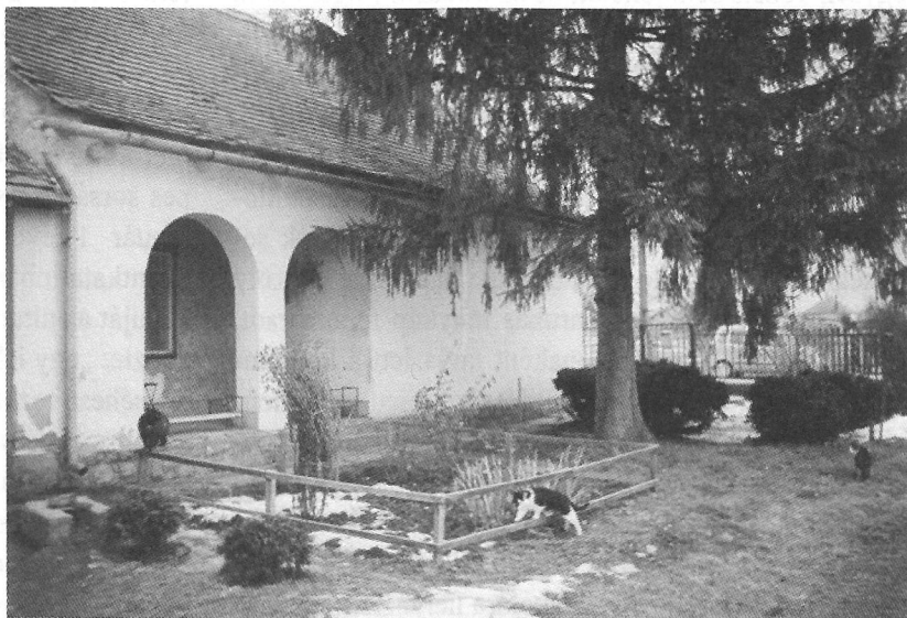
ONCSA-ház az udvar felől (Kistótfalu 2005. március)