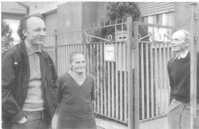
Szüleivel falusi házuk kapujában

tása elől az irodalom nem térhet ki. Felelősséggel tartozik azokért, akiknek érdekében az igazságot ki kell mondani. S ha nem piszkolódott be hamissággal, a tiszta szó – nem lehet kétség felőle – megtalálja olvasóit. Hasznos erővé válik.