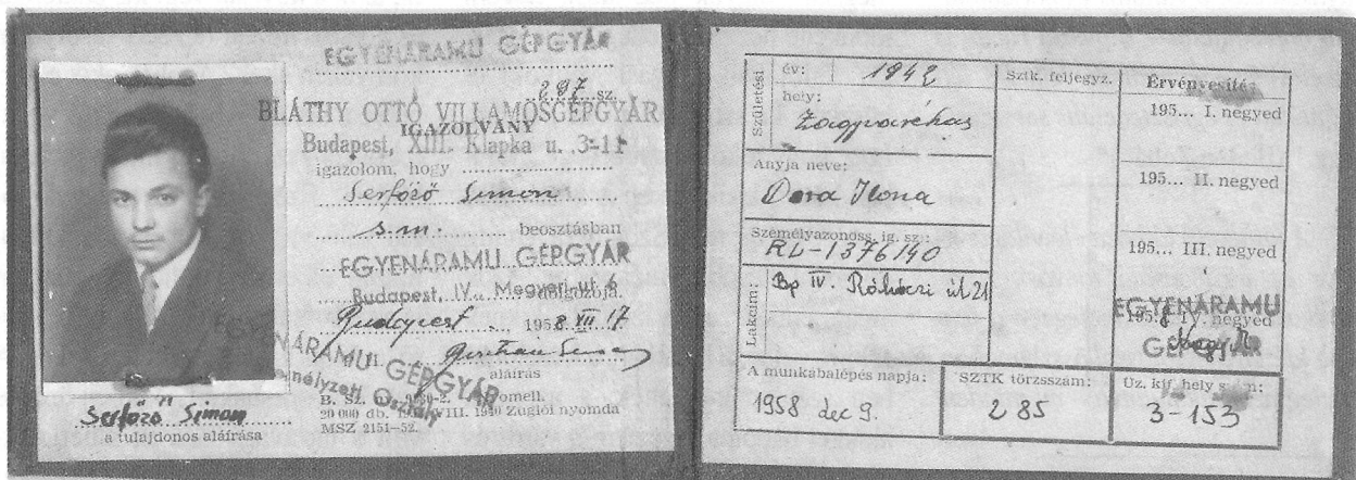
Igazolványkép segédmunkás korából

– Az irodalomnak a teljes élet ki-mondására kell törekednie. Semmi nincs, amihez köze ne lenne: a múlttól a jelenig, születéstől a halálig. Ezek olyan evidenciák, szégyellem leírni. Muszáj mégis, mert mindig történnek arra kísérletek, amelyek – tapasztalhatjuk – nem is eredménytelenek, hogy az irodalmat megszerzett rangjától megfosszák, bizonyos ügyekben kétségbe vonják illetékeségét, fontosságát elvitassák. Méginkább, hogy igazságtartalmait félremagyarázzák. Éppen ezért igyekszem műveimben tisztán, egyértelműen szólni, szeretek szókimondó lenni. Úgy érzem, hogy ezzel a legnehezebb utat választom. Hiszen a cél, hogy az igazság ki-mondásán túl ezt a szólást a legmagasabb művészi fokon valósítsam meg. S azon a nyelven, amelyet a magaménak tudok. A lehető legmélyebbre kellett ezért magamba leásnom. Onnan, a tudat és az öntudatlanság legalsó rétegeiből felhozni gyerekkori szótörmelékeket, elfelej-