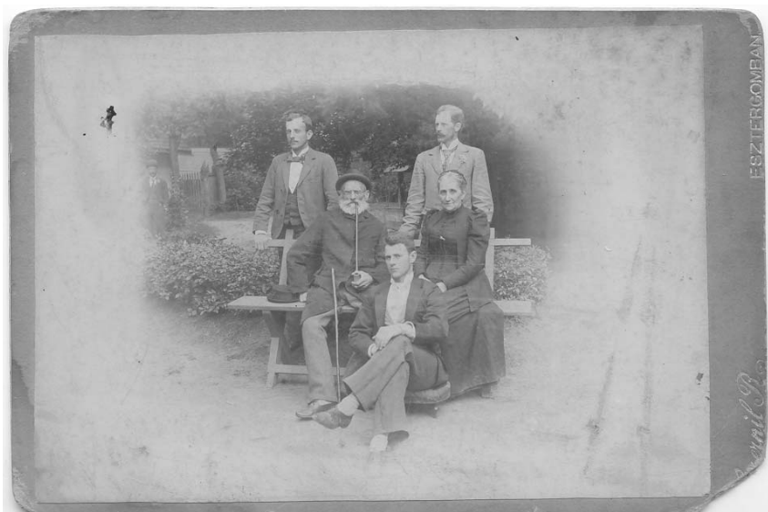
A Ferdinandy dédapá, akit Haynau halálraítélt 1849-ben, felesége és három fia

kem ezt utólag úgy mesélte, milyen jó stiklit csinált, mert mindenki hülye volt körülötte, így nem volt nehéz átverni a hatalom embereit. De lebukott. Akkoriban elkezdődött már az idegsorvadása, de mindig azt mondogatta, hogy ez harminc évig fog tartani, s azalatt pont felnövök. De amikor