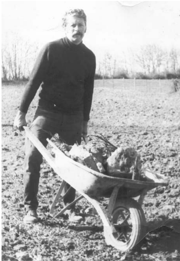
Francia tanyán (1971)