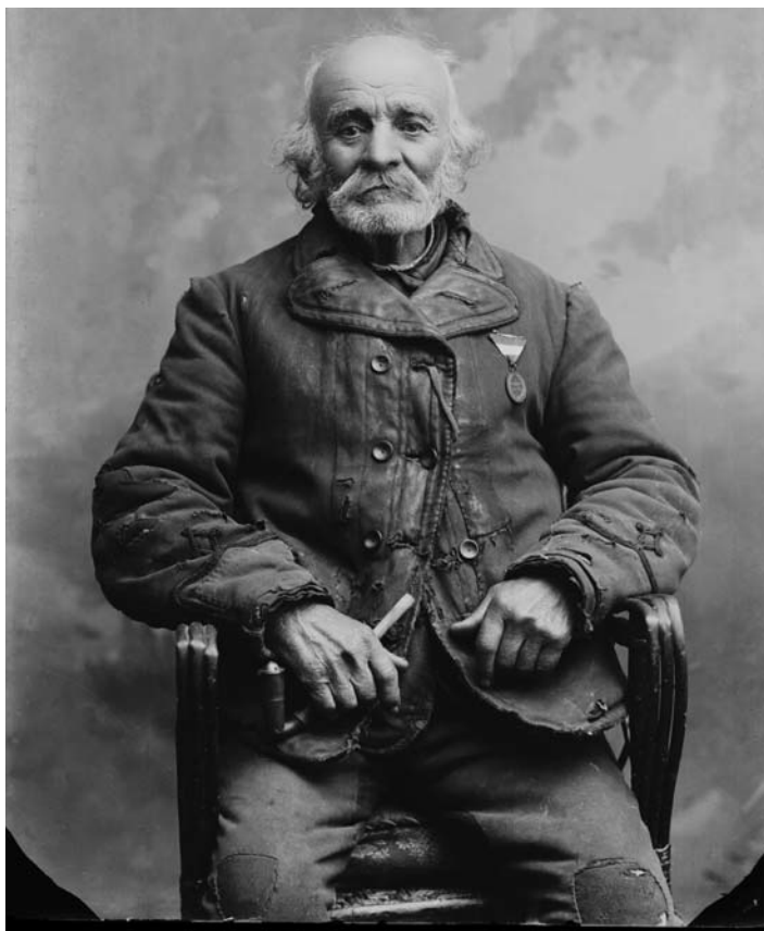
Ismeretlen 48-as honvéd

A forradalom történetét napról napra ismerjük, a résztvevőknek, s azoknak, akik így s úgy belekeveredtek, őrzi saját történetét az emlékezete, de az akkori mozgató érzelmeket, a meglepő lelki állapotot már sokkal nehezebb fölidézni. A szabadság elvarázsoltjai voltunk mindannyian. Ma sem tudom, miért éppen az a valamelyik mozzanat, mondat indított, s bontott ki