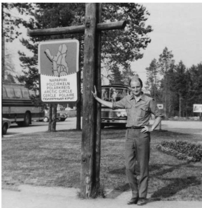
„Finnországban, Rovanieminél az északi sarkkörön” (1972)