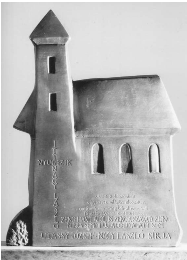
„Nagy László sírja”

Bucskázom az őszben, tolvaja, csősze vagyok. A szilva, szőlőszem rébusza, hogy hova lop.