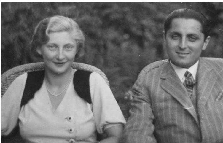
„Szüleim” (harmincas évek közepe)

– Az MTI-fotóhoz kerültem 1958-ban. Laboráns lettem: nagyméretű nagyításokat készítettem műszaki és riportfotókról. Néme-lyik még ma is látható: történetesen Eszterék iskolájában is van néhány a folyosón Kodály Zoltánról.