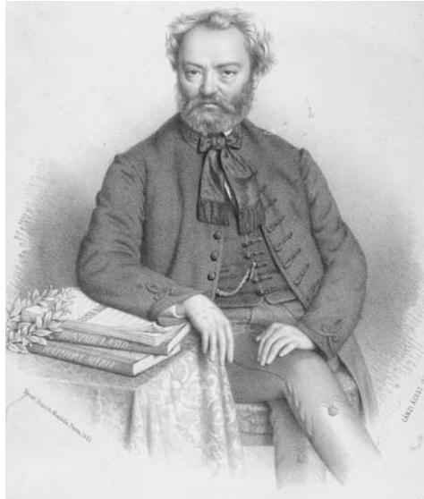
Erkel Ferenc ( Canzi Ágoston könyomata, 1861 )

oktatásukra. Ezt bizonyítja Erkel következő lépése is, azaz a Stainlein-Saalenstein család szemerédi birtokára való utazása, ahol ugyancsak tanítói állás várta. (Az 1830-ban grófi rangot nyert család később is aktív zenei életre vágyott, hisz Volkmann Róbert 1840-ben rövid ideig ugyancsak itt oktatott.) A sors szerencsés fordulata lett útközben a Nemzeti Casinóban történt fellépése, amely meghozta számára zongoraművészi elismerését, ez pedig megnyitotta számára pályájának további lehetőségeit.