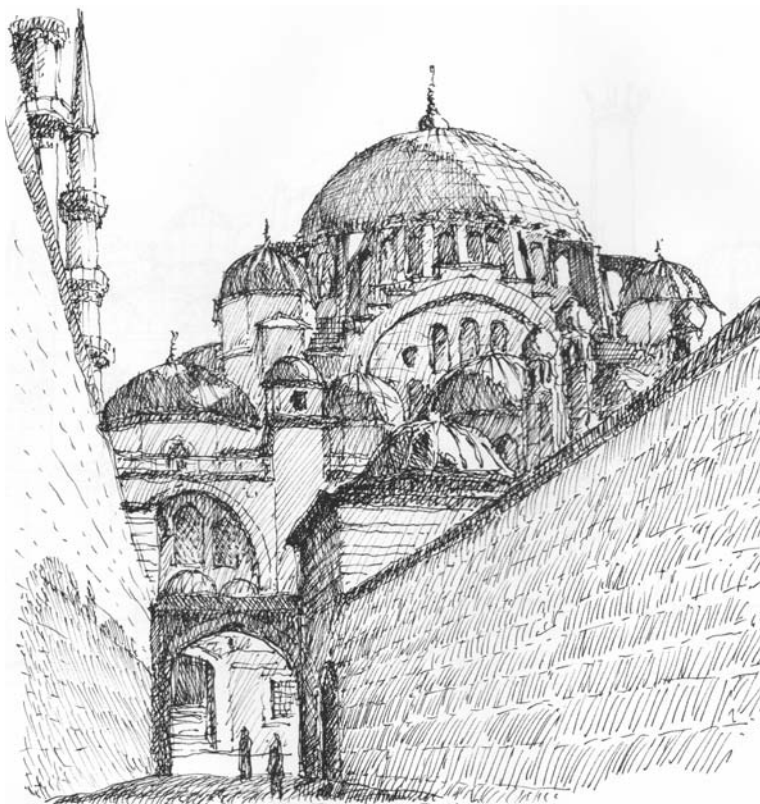
A Süleymaniye nagy kupolája, K. Pintér Tamás: Török rajzok című könyvéből

K. Pintér Tamás az évek során a török kultúra szerelmese lett, a Török–Magyar Baráti Társaság egyik