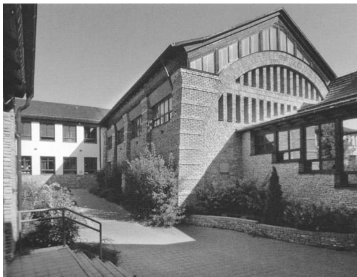
József Nádor Művészeti Általános Iskola (Üröm), Turi Attila könyvéből

(K. Pintér Tamás: Török rajzok . Litea, 2010.)