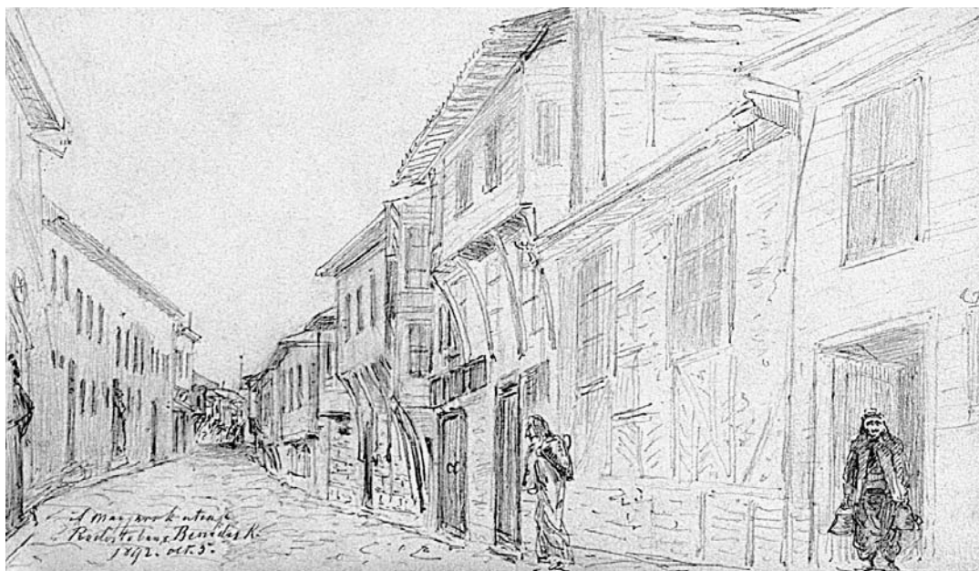
Beszédés Kálmán: A magyarok utcája – 1892. oct. 5.

Az első leveletem, amidőn a nénémnek írtam, huszonzét esztendő voltam, eztet pedig hatvankilencedikbe írom; ebből kiveszek 17 esztendőt, a többit haszontalan bujdosásba töltöttem. A haszontalant nem kellett volna mondanom, mert az Isten rendelésiben nincsen haszontalanság, mert ő mindent a maga dicsőségire rendel. Arra kell tehát vigyáznunk, hogy mi is arra fordítsuk, és úgy minden irántunk való rendelése üdvességünkre válik. Ne kívánjunk tehát egyebet az Isten akaratjánál. Kérjük az üdvességes életet, a jó halált és az üdvességet, és azután megszűnünk a kéréstől, mind a büntől, mind a bujdosástól, mind a telhetetlen kívánságtól. Amen.