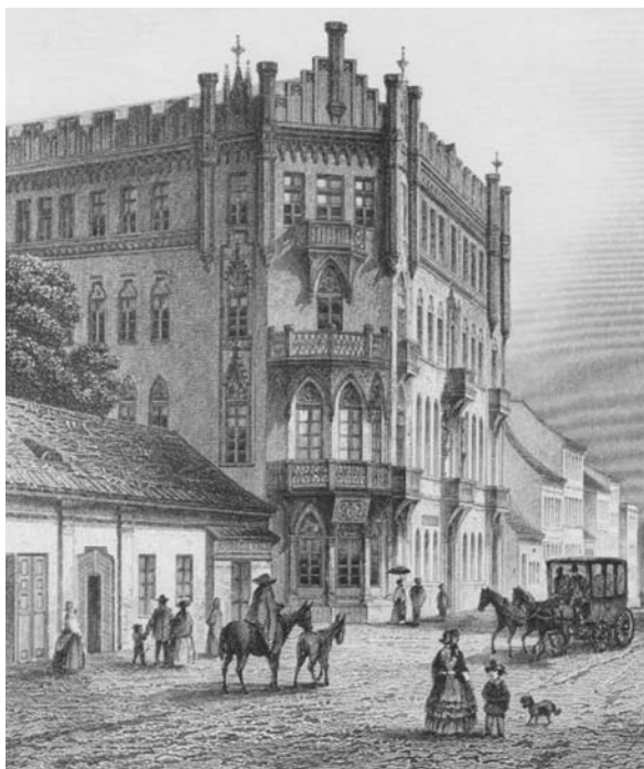
A Pekáry-ház a Király utcában, a XIX. század végén – még palota korában

Ám ebben a Király utca 47-es számozású házában való lakásnak van még egy – ha akarnám, akár misztikusnak is nevezhetném – érdekessége. Csak valamikor húszéves korom tájt tudtam meg, hogy ez az épület híres, egykor Pekáryháznak nevezték. Addig nekem senki se mondta, talán már senki nem is tudta az akkori lakók közül. A XIX. század derekán építtette Budapest akkori főrendőre: újonnan talán palotának számított. Vörös márvány körlepcsője van, finoman cizellált kovácsoltvas korláttal, hintókat, konfliktusokat fogadni képes kapualjjal, a kapu fölötti emeleti lakás erkélyes – bizonyára itt lakott a háztulajdonos –, az ablakkeretek, az erkély korlátja faragott kövekkel díszített, az Országházon látható kőfaragásokhoz hasonlatos. Mindezekből feltűnhetett volna, hogy a mi házunk különb, mint a környékbeli többi, de gyerekként nem észleltem – talán azért sem, mert az akkor éppen százéves, két világháború gonoszságait és nyomorúságait átvészelt ház iszonyatosan leromlott állapotban volt. Belül a lépcsőház is, a lakások is – nyikorgott a fagerendázat, repedeztek a falak, valamiért mindig érezhető volt a pincszag –, de kívülről aztán különösképpen. Sarokház lévén hosz-