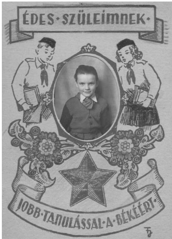
Tanév végi fényképezkedés, 1951

iskolában, üzletekben, mozikban, a lakásokban is. Gondold csak el: a háború alatt az emberek nagy részének hónapokig nem volt módja rendesen tisztálkodni, nem voltak mosó- és fertőtlenítő szerek,