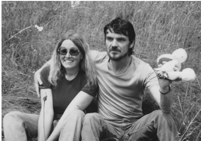
Gombavadászaton a Börzsönyben

Kortársnak is küldtem írásokat, jól fogadtak. Ez az időszak az ötvenes évek – és jó néhány szocialistának nevezett országban tovább uralkodó – dogmatikusságának óvatos levedlési ideje volt, fiatalon persze örjítően lassúnak