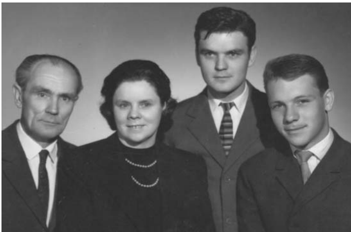
Szüleimmel és öcsémmel

A másság törésvonala nem is itt húzódott, hanem a vallásos és nem vallásos gyerekek között. Őt hat erősen hívő fiú járt az osztály-