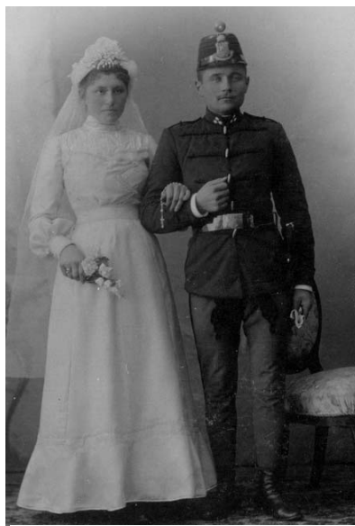
Anyai dédszüleim, 1905

kérdésekre sincsenek egyszerű válaszok. Például nekem szülőhelyemből is kettő van. Először, ugye, a szülővárosom: Budapest, s van a szülőföldem, a fölnevelő szülőtájam: a Komárom melletti Izsa. (Illetve a Duna mentének ez a