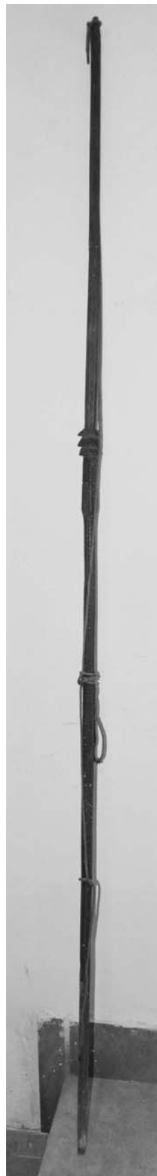
A kócos guzsaly

A guzsaly, a csobánbot, a kalimárosbot galagonyából, kucsasomból 15 és somfából készült. Azaz a guzsaly és a csobánbot, bácsbot azonos anyagból készült, és az alkotórészeit is azonosan nevezik.