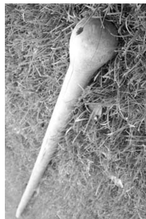
A csamikás csobánbot