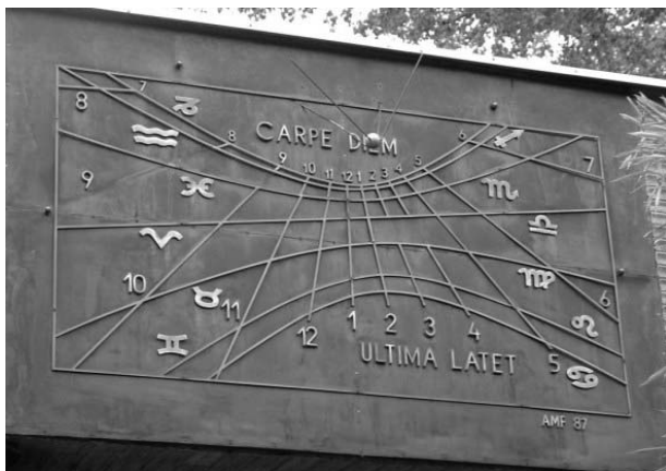
Ponori Thewrewk Aurél napórája és kalendárium a budapesti Planetárium jobb oldali bejárata felett (bácsbot és egy csobánbot együttesen ugyanígy működik)

Úgy gondolom, régen nemcsak a csángók ismerték a pásztorbotos kalendáriumot. Egy taktaszadai (Magyarország, Szerencs mellett) mondában ez áll: „az öreg Lipics az ókenyizsi erdőbe volt bivalygulyás. És őneki olyan tudománya volt a botjában, hogy azon a boton 365 görcs volt. És ő egyebet nem hordott magával, csak a botot.” 11 Tehát Lipics gulyás-talatosnak a botja ugyanazt tudta, mint a csángók két botja vagy Ponori Thewrewk napkalendárium.