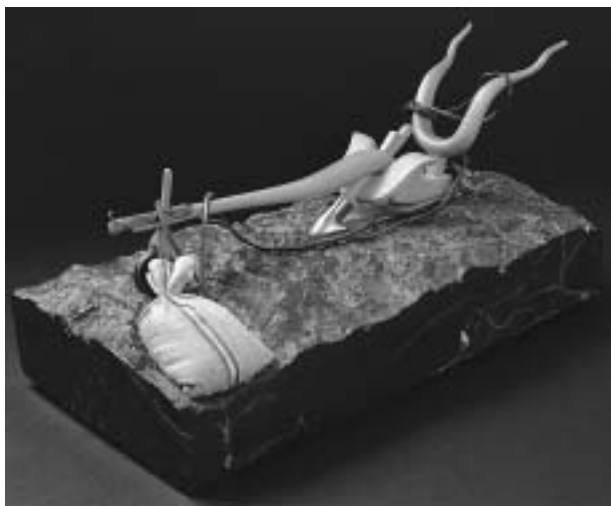
Emlékeim a régi magvetőről

Végül a halállal való szembenézés, amire romló egészségi állapota is sarkallta, vitte a zen-buddhizmus felé is, amely a látzólag ugyanabba a hétköznapi életbe lép vissza, ahonnan elindult. Ilyen szövegeket fordított az ötvenes évek közepén. Tíz év múlva ezekkel összhangban tisztulnak le a mulandóság és a realizálás körül forgó legbelső gondolatai. Hamvas több levelében is bevallotta, hogy tudatosan törekszik korábban leírt gondolatainak tényleges valóra