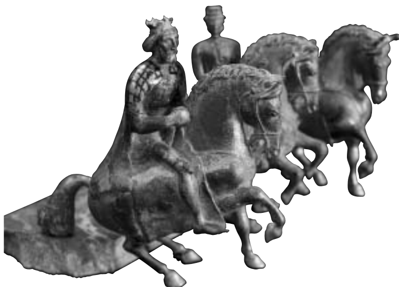
Szent László és Sisi

Akkor aztán darab időre úgy volt, hogy mindegy volt éppen nekem, hogy a Nap kel-e föl, vagy a Hold; mindegy volt, hogy egyszerre látszik-e mind a kettő, vagy valamelyik, vagy egyik sem. Sok idő elfolyt így, és már nem vártam semmit, nem akartam semmit. 10