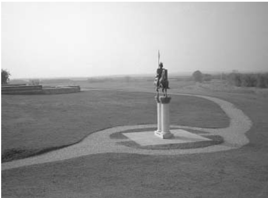
Veszprém-mágori táj a Szent László-lovasszobornál

dolomit, kalcium, magnézium-karbonát, laza szövetű mészkő, lösz, iszap, az apát-ság velünk éppen szemben a szélben forgó két csúcsával, a koppenhágai te, az én, aki akkor te lehettél volna, a te, aki huszonöt éve a kikötőben megpihentél és elgondolkodtál azon, mi lesz a kikötőben elgondolkodott énnel huszonöt év múlva, ez az ide-oda cikázás, oda-vissza, le-fel. Tudtad, hogy ebbe a tóba egyszer már Közép-Európa belefulladt? Képzeld el Közép-Európát mint egy vízihullát. És az apró, érdes héjú miocén kagyló, a Congeria unguiculaprae után kutatva lemerülünk a medence aljába a gyerekekkel, hogy megtaláljuk a kegyetlen király-lánynak kicsi csontvázát, a megtört szívű kecskepásztor vízihulláját és az ezer aranyszőrű kecske csontjait, mely valamiféle homorú, üres agyagedény alján elveszett. Azt mondják, lösszé váltak, bazalttá, magnézium-karbonáttá, tufává a végén. Majd aztán egy egész apátsággá. Aztán egy kéziratá. Majd egy apáttá. Apákká. Egymás maradványaiból készülünk úgyis. Ha elsétálnál éjjel a tó mellett, egy üres szemüveget látnál, olyan tágasat, mint a világűr. Az a szem egy megszámlálhatatlan csigalépcsőkből épült város, mely már rég elmerült. Fekete pupilláját vibráló kicsi házak és tapsikoló vitorlások kerítik körbe. Kolompolásuk fémszerű, mint az Északi-tenger hajóié. Talán valamivel halkabbak. Nézd a nyugati ajtócsigát, azt, amelyiknek gyűrűs a szája, ahogyan végigkúszik a papíron kondenzcsíkot hagyva maga után.