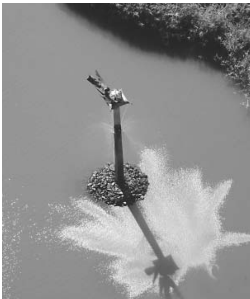
Szent Korona-emlékmű, Szarvas

Ez a színdarab azonban így, önmagában is a Nyirő-életmű és a magyar drámaírás jeles alkotása, örökbecsű remeke marad.