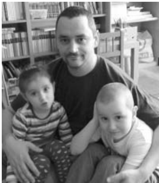
A költő gyermekeivel, Vandával és Ábellel (2012)

– Festményről írni: kísérlet. Mitör fel a lélek mélységeiből, milyen képi válaszok alakulnak