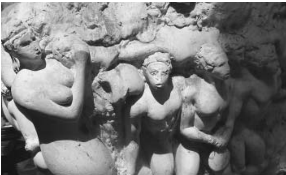
Olimpiai emlékmű, Budapest