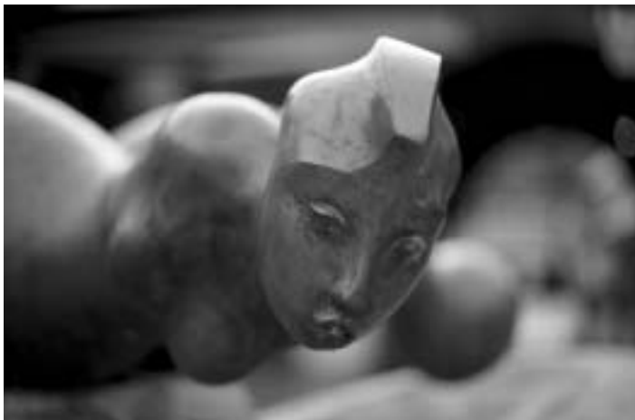
Sellők kútja, Balatonalmádi

Betereltek minket a nagyterembe, némán feszengtünk az amerikai lobogók színes lepedői alatt. Megtapsoltuk mester Beach beszédét, a botrány akkor tört ki, amikor lefordították nekünk, hogy az amerikai nép – úgymond – a szívére ölel minden magyar gyereket.