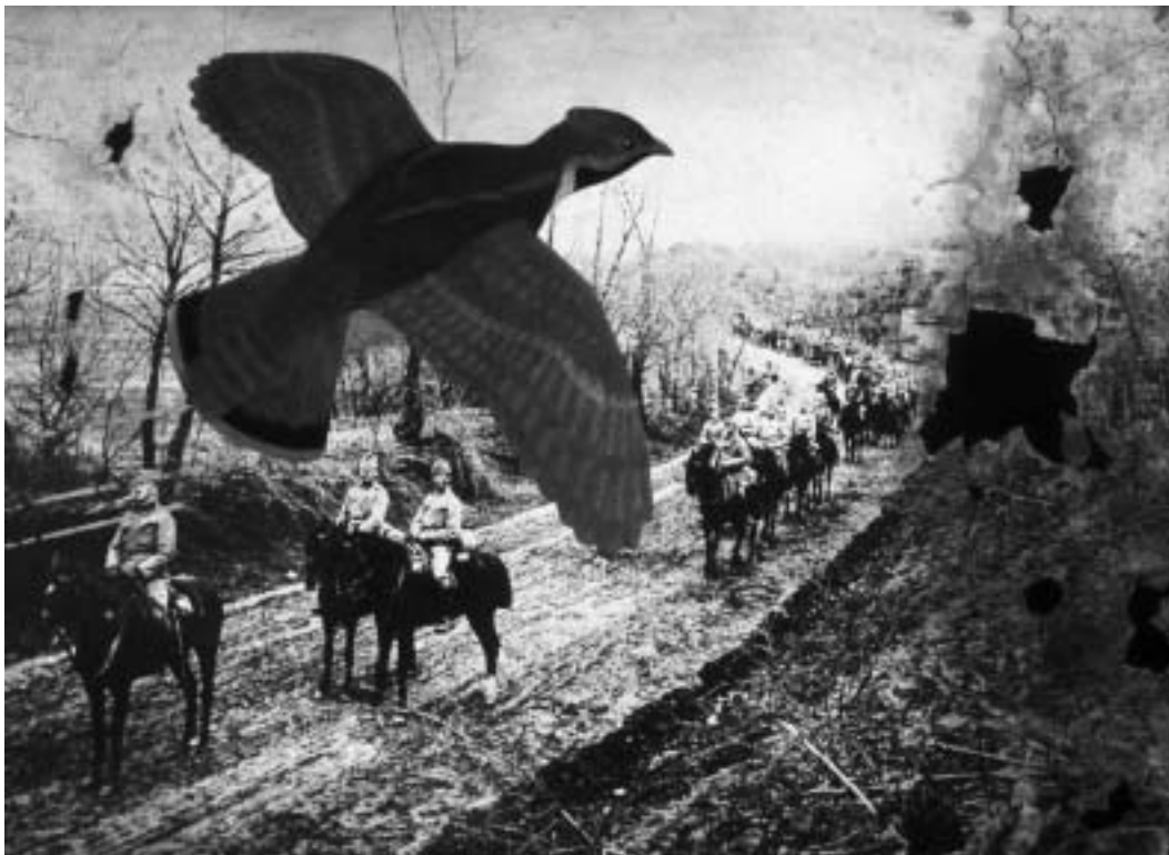
Császármadár – Nagypám emlékére

Sem a pad, az éjszakai buszmegálló, sem az ulisszeszi tengerekre néző konyhaasztal, sem a költözések dobozai közt elsurranó ifjúság. Egyre kevesebb az, mi ide köt, itt marasztal. Hogy lehetnének-e még nagy nemzedék – kétlem. De szívesen vitázom Veled, ha javunkra válik. Talán ha utolér minket a történelem, s megértjük, mi végre bukdácsoltunk el idáig... De addig, csak sötét ruhás, csomagos idegen maradok. Akit épp nézel, s azon tűnődsz, csokorral kezében, vajon melyik vonatra vár. S lobog köröttünk egy különös évszak: a szélben virágok vonulnak, nimfák, s megtépett szalagok.