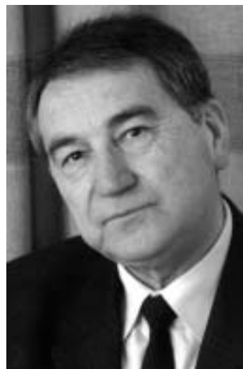
Görömbei András (1945–2013)

Végzetlenül szomorúsággal, kibeszélhetetlen fájdalommal élem meg, hogy a Te tanár-emberi lényedet oly pontosan kifejező, sokaknak egyedülállóan kedves »üvegharang« nem szólal meg többé. S habár mostantól új időszámítás kezdődik, Hozzád és életpéldádhoz csak akkor lehetünk hűségesek, ha minden korábbinál jobban fel tudunk nőni a feladathoz. Hiszem és tudom, hogy odafönről is segíteni fogsz.