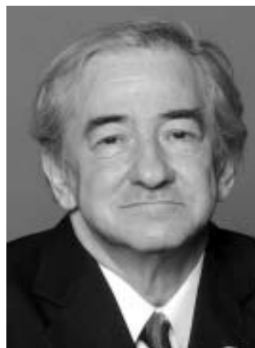
Marsall László (1933–2013)