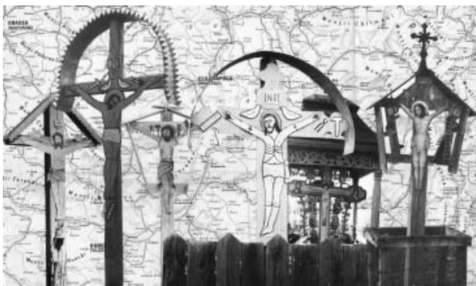
Erdély – 1985