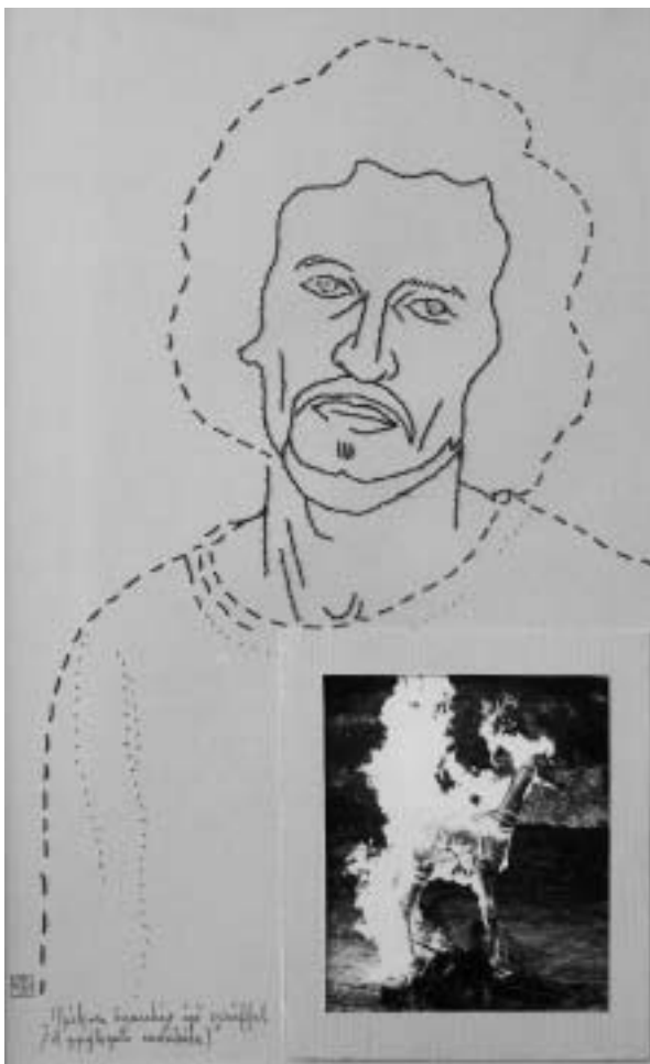
Ifjúkori önarckép égő zsirúffal