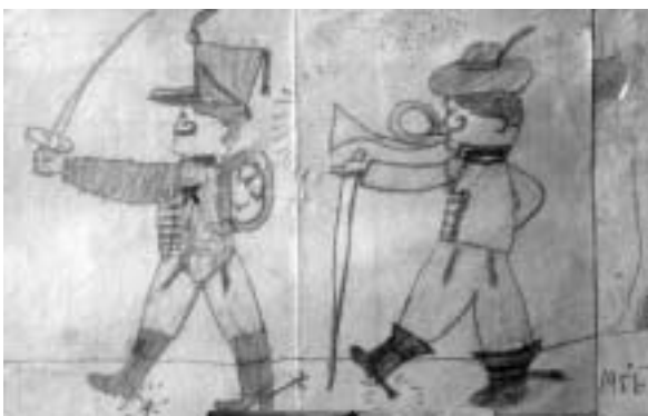
Gyermekkori rajzok, 1956