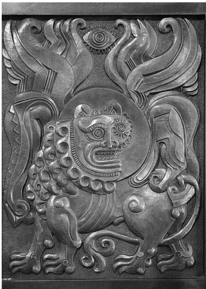
Tabernákulum ajtó (részlet), 25 × 30 cm, 1989. Cegléd