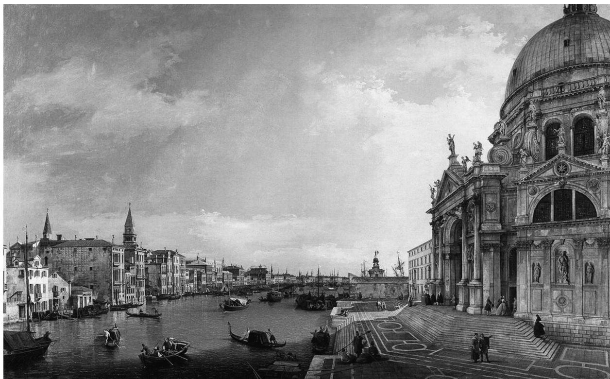
Canaletto: A Canal Grande bejárata, 1744