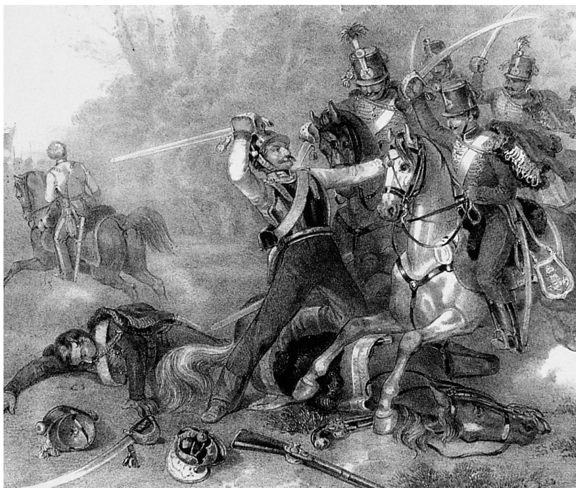
A kompolti győzelem 1849. február 18-án. Metszet Hermann Róbert gyűjteményéből (részlet)

zá. Néhány budapesti kiruccanásnak köszönhetően már komolyabb munkákat is sikerült megszerez-nem az itteni antikváriumokban, aztán egyetemistaként már tényleg elég komoly könyvtárat gyűjtöttem be. Akkoriban kezdtek el felszámolni az Akadémiai Kiadó raktárkészleteit: a Kossuth Lajos összes munkái 1848–49-es kötetit és jó néhány más forráskiadványt és feldolgozást ekkor vettem meg.