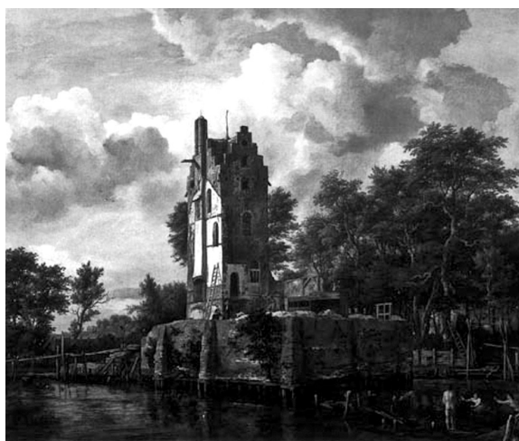
Jacob Isaacksz van Ruisdael: Az Amstel partján, 1664

megfosztó kataklizma a náci vereségével együtt megszűnt, de a történet- és irodalomtudomány számos tekintélye szerint minden más megrázkódtatásnál jobban megváltoztatta az embernek a saját történetéről és integritásáról kialakított felfogását. Az újabb politikai érdekharokba kapcsolt hivatkozás a holokausztra az emberiségnek a népiábráról való kollektív emlékezetének felhígulásához vezetett. Csak szórványosan alakult ki a történelmi tényekkel való számvetése és etikája, amelyet nálunk Bibó István képviselt legszínvonalasabban. Az empatikus érzelmi feldolgozásról pedig Pilinszky költészete adott minden időre szóló példát. Mégis kevésbé kapcsolódott össze az emberek tudatában a holokauszt tényével, hogy a második világháború ötvenmillió halálnak és még egyszer ennyi sors kisiklásának, családok megsemmisülésének is okozója volt. Az azóta zajlott és zajló helyi háborúk is mérhetetlen szenvedéseket okoztak. E tényekre épülhet a humanus törekvés, hogy az író az utókor köztudatába helyezze a fogadalmat és követelést, hogy a népiábrát és gyűlölködés többé ne ismétlődjön meg, tetszetősen