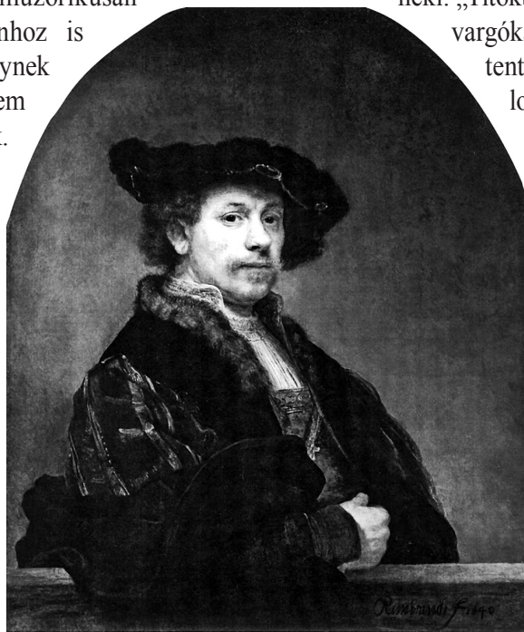
Rembrandt: Önarckép, 1640

ja tanulmányozni a művészetet, jobban tenné, ha odahaza maradna és belépne a pékek céhébe, vagy szabó lenne, vagy halászatot üzne; mert az igazi tehetség utat tör magának, még ha sohasem lép is ki az otthoni utcákból; és akiből hiányzik a természetes hajlandóság, abból nem csinál igazi művészt semmiféle olasz naplemente, semmiféle francia napfelkelte, semmiféle spanyol szent és semmiféle német ördög”. Valóban így van ez, hisz minden minőség napvilágra jött az ihlet, a megszállottság és a lelki alkalmatosság karizmáján múlik; átsugárzik a valódi remekműveken, miután alkotójuk nem csupán a materiális valóságból, hanem az abból sarjadó szellemi motivációból is származtatja erejét, amit ujjainak és ecsetjének mozdulataival zsigeri áramlatként vezet át a teremtésre szánt mű dimen-