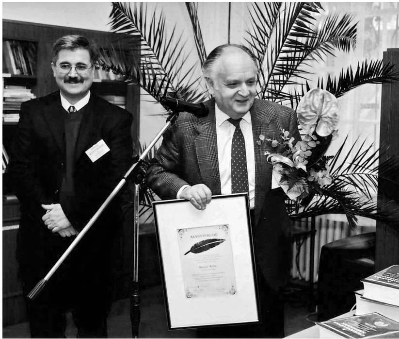
Az Aranytoll-díj átvételén 2002-ben

máshová is elmentünk: például Texasba és Floridába. A folyóirat a LACUS lapja volt, de elkezdtek ötszáz oldalas évkönyvekben kiadni a minden augusztusban elhangzott előadásokat is, amelyek huszonöt éven át könyvformában jelentek meg, sőt ma a világhálóról le is tölthetőek. Én vezettem mint „executive director” és főszerkesztő negyedszázadon át.