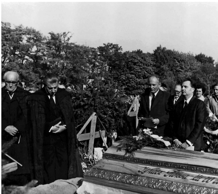
Göncz Árpád mellet édesanyja temetésén, 1979. október elején

– Álljon itt Weöres Sándor A galagonya (The brambleberry) című remeke magyarul és ango- lul, azonos rímeléssel és szótag- számmal; úgy, ahogy feleségem- mel, Ágival szinkronban szoktuk