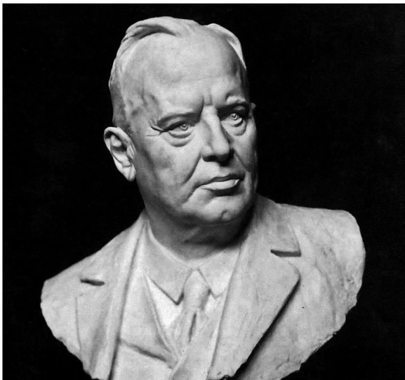
A nagyapa, Makkai Jenő koronaügyész mellszobra, amely megsemmisült az 1945-ös ostrom során

– Majdnem száz százalékban. Tornából és a nyári katonaság alól fel voltam mentve. Miközben az osztálytársaim rúgták a focilabdát, én ültem egy karosszékből és Dante Poklát olvastam Babits felejthetetlen fordításában. Ebben a képben, úgy érzem, minden benne van.