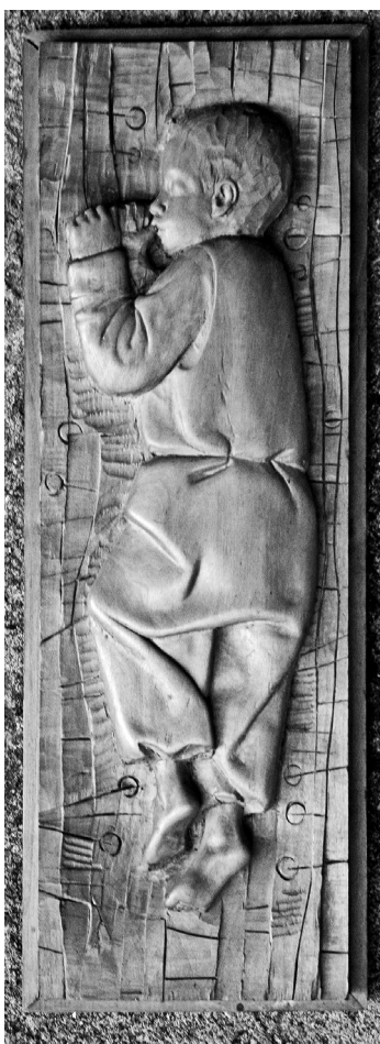
Karcsi (fafaragás, 1970-es évek, fotó: Oláh Katalin Kinga)

A Szűkülő szemmel (1994) versvilága s maga a kötet címadó költemény is az idill és a tragikum, az életöröm és az elmúlástudat kettősségére épül. A líravilág eddigi eredményeit és legfőbb értékeit a kötetbeli művek közül a Babits Mihály a szőlőhegyen című szerepvers foglalja magába. Ez a mű a nagy előd Ősz és tavasz között című költeményének palinódiaszerű párja. A szintéziselvű vers Kiss Benedek szemléletformáiról, törekvéseiről, létérzékeléséről és költői habitusáról talán minden korábbinál beszédesebben árulkodik.