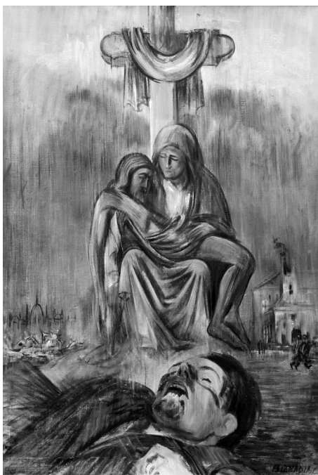
1956 áldozatainak emlékére (olaj, vászon, 100 × 80 cm)

A betiltásnak kevés értékes dokumentumfilm esett áldozatul, ami annak „köszönhető”, hogy közülük sok alkotás el sem készülhetett. Illetve amikor mégis leforgattak, majd bemutattak egy-egy fontos társadalmi vagy történelmi jelenséget tárgyaló dokumentumfilmet, gyakran igen rossz volt az adott mű szakmai visszhangja. A pártállam az újságírók jelentős hányadát megvásárolta, akik igyekeztek is meghálálni az évek során kapott juttatásokat: magas fizetést, prémiumokat, tisztségeket, lakást stb. A kritikusok közül többen a Pócspetri (1983., r. Ember Judit) megkésett bemutatása után is a film dramaturgiai és esztétikai hiányosságain fanyalogtak, miközben nem méltányolták azt a tényét, hogy végre nyilvánosan is lehetett beszélni az 1945 utáni időszak koncepciós pereiről. A pócspetri ügy több volt, mint egyszerű, statáriális