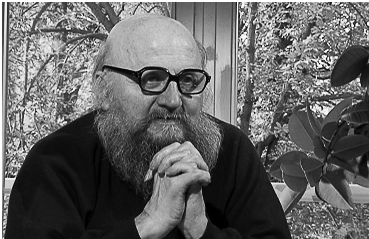
Jánosi Antal portréfilmjében

nem ér semmit a szorgalom, mert az ihlet vagy jön, vagy nem jön. Tehát hiába vagy te szorgalmas, s akár napi tizenkét oldal verset írhatasz – ennek csak egy része lesz jó, amit ihletett állapotban írtál.