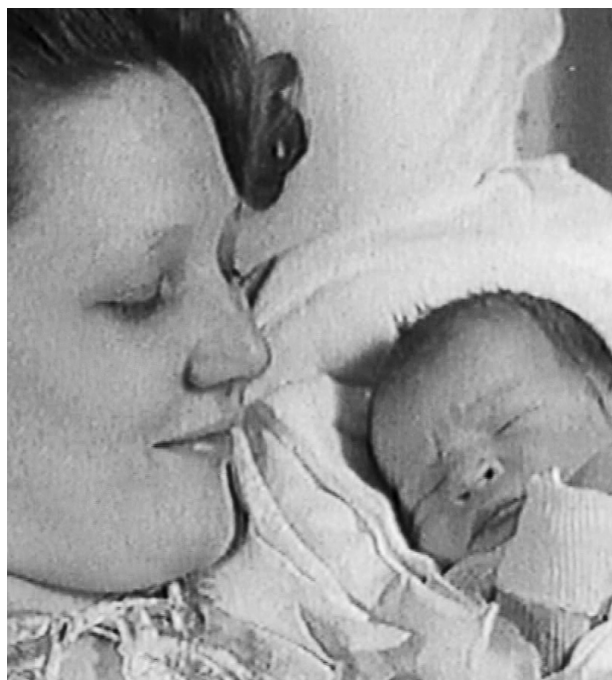
Felesége a gyerekekkel

Nyugdíjba mentem, azóta élem a nyugdíjas életemet. Nagy örömmel mentem amúgy nyugdíjba, mert meg kell, hogy mondjam: soha életemben nem voltam a munka hőse. Másokkal szemben én nem szoktam mondani, hogy imádok dolgozni, mert nem imádok dolgozni – sőt, ha más mondja ezt, erősen megkérdőjelezem. Bár vannak olyan munkák, amiket szívesen csinál az ember. A költészetben az a helyzet, hogy