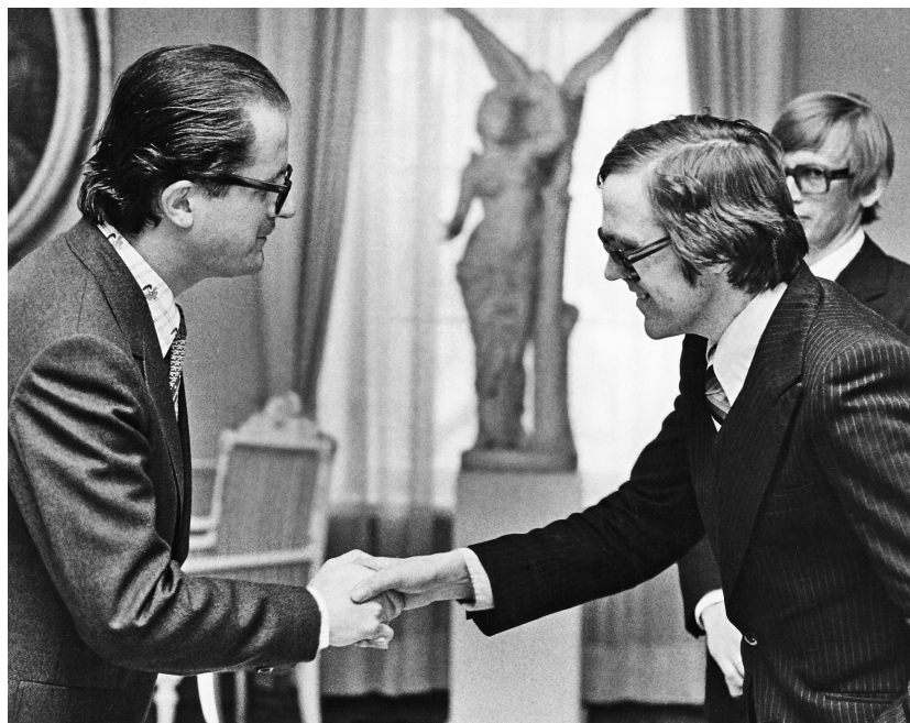
A finn Állami Irodalmi Díj átvétele 1976 májusában. A díjat Kalevi Kivistö kulturális miniszter adja át.

a hagyományos versformával. Elvetették a rímet, szabad formákra tértek át: azt vallották, hogy a tartalom az elsődleges, a forma felesleges dísz. Azóta Finnországban nem lehet rímes verset írni. Ez persze a líra egyfajta beszűkülését is magával hozta: még akkor is, ha finnül nehezebb rímelni, mint például magyarul, a költő kénytelen a nyelvet megerőszakolni, megváltoztatni a szórendet, mesterkéltté válni. Ezt vetették el az ötvenes években indult nemzedékek képviselői. Ugyanakkor rendkívül kép gazdag, érzéki költészetet hoztak létre. A hatvanasok generációja ezt is sokallta, és áttért a szikárabb, tárgyiasabb költészetre. Mára a rímes vers a kuplék, slágerek világába szorul vissza.