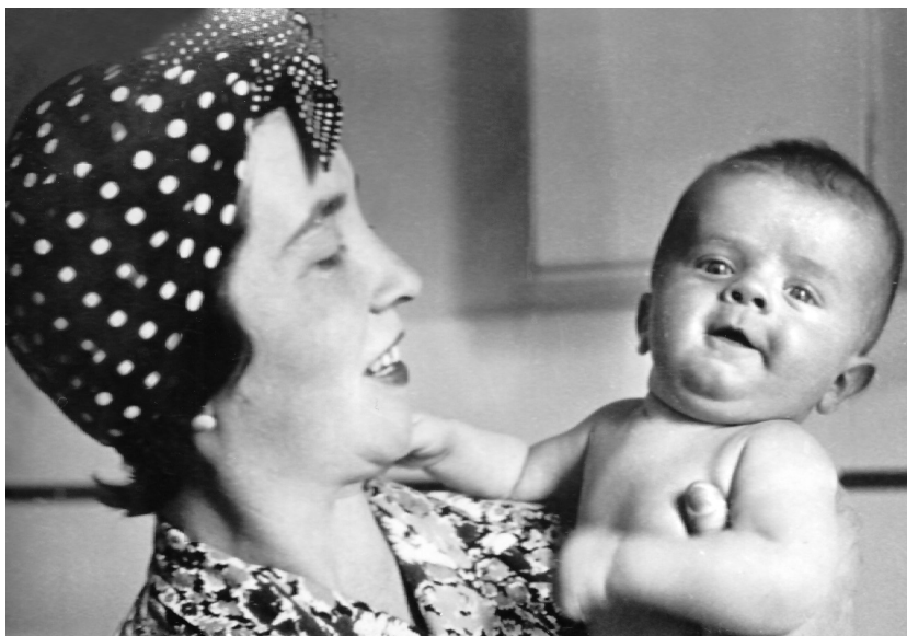
Legelső bemutatkozásom. Édesanyám karján

legesen nem vettem részt semmi- ben, a retinámra kitörölhetetlenül ráégett mindaz, amit a városban tett csavargásaim során láttam: a szét- lőtt házak, a menekülő emberek, a kiegészített tankok, az elesett civil és katona áldozatok látványa. És még ma is a fülemben cseng az az eu- fória, amely apámat eltöltötte, és amely rám is átragadt: két hétig valóban hittük, hogy Magyarország felszabadult; hogy kivonulnak az oroszok, és megszűnik az az iszonyú légkör, amelyben addig éltünk.