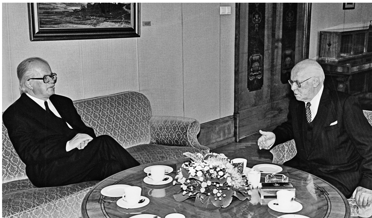
Nagykövetként Lennart Meri észt köztársasági elnökkel 1999 őszén

a nemzeti ünnepeiken (amely augusztus első szombatjára esik); azt hiszem, a hosszú vendégasztal mellett minden élő lívvel kezelt szoríthatam. Akkoriban nagyjából másfél tucat lív anyanyelvű élt még, ők is hetven-nyolcvan évesek voltak. Funkcionális stílusban, finn, magyar és lett állami támogatással épült központjukat, a mazarbei Lív Házat, amelyet közvetlenül a világháború kitörése és Lettország szovjet megszállása küszöbén avattak fel a három rokon nép képviselői, most igyekeznek újraéleszteni. Kis létszámuk miatt ez persze ma már inkább csak múzeum és archívum, ahova a világban élő lív leszármazottak dokumentációját igyekeznek összegyűjteni.