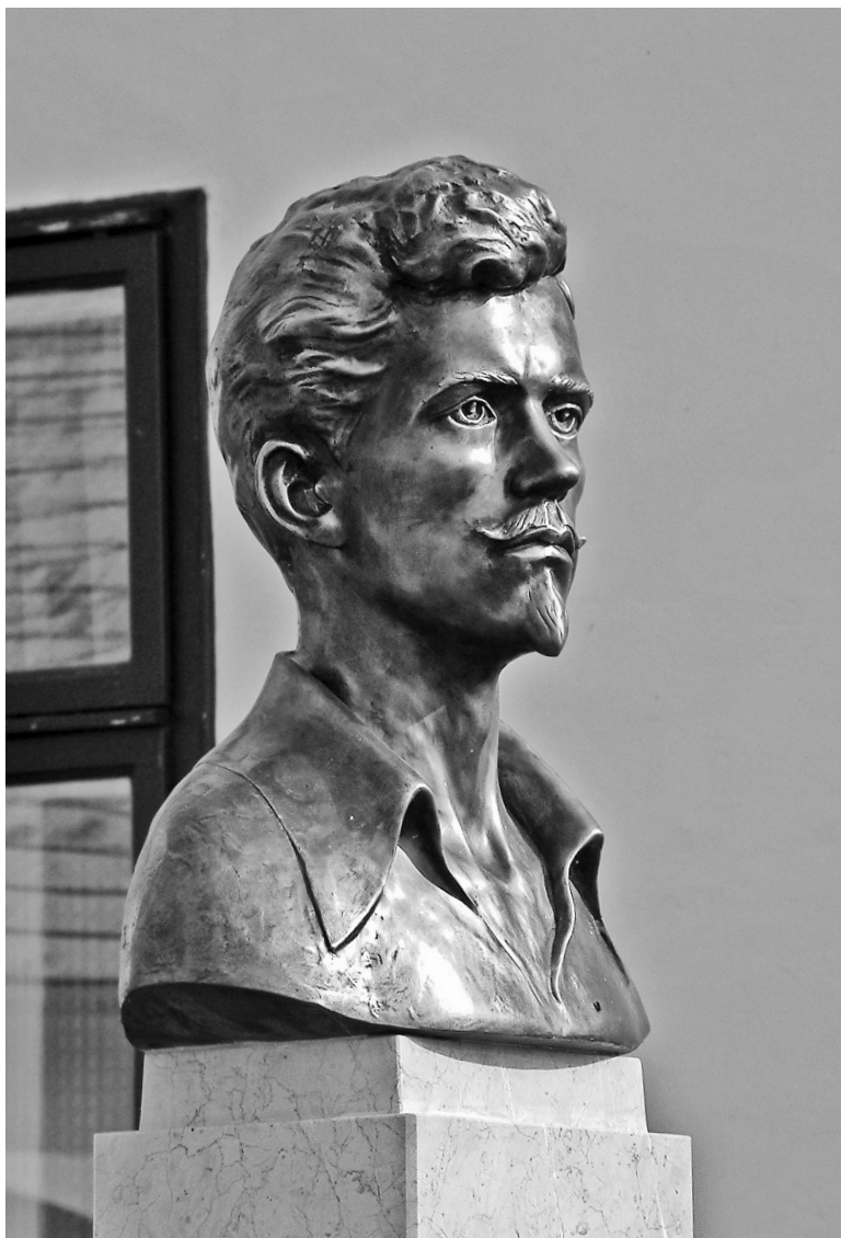
Vanyúr István alkotása (2005, Kisdobsza)