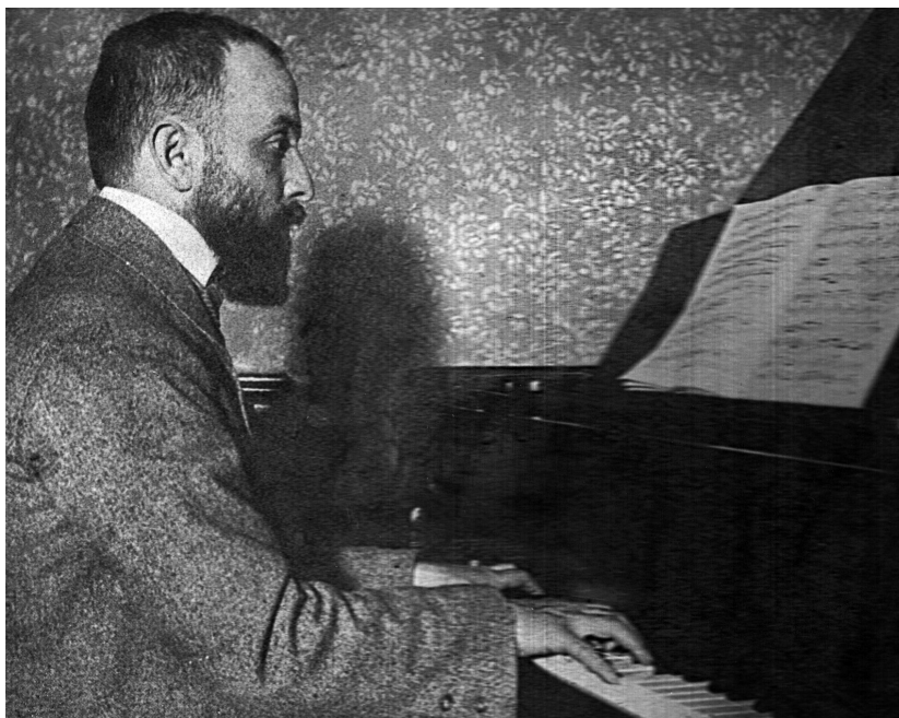
Anyai nagyapám, 1900-as évek eleje