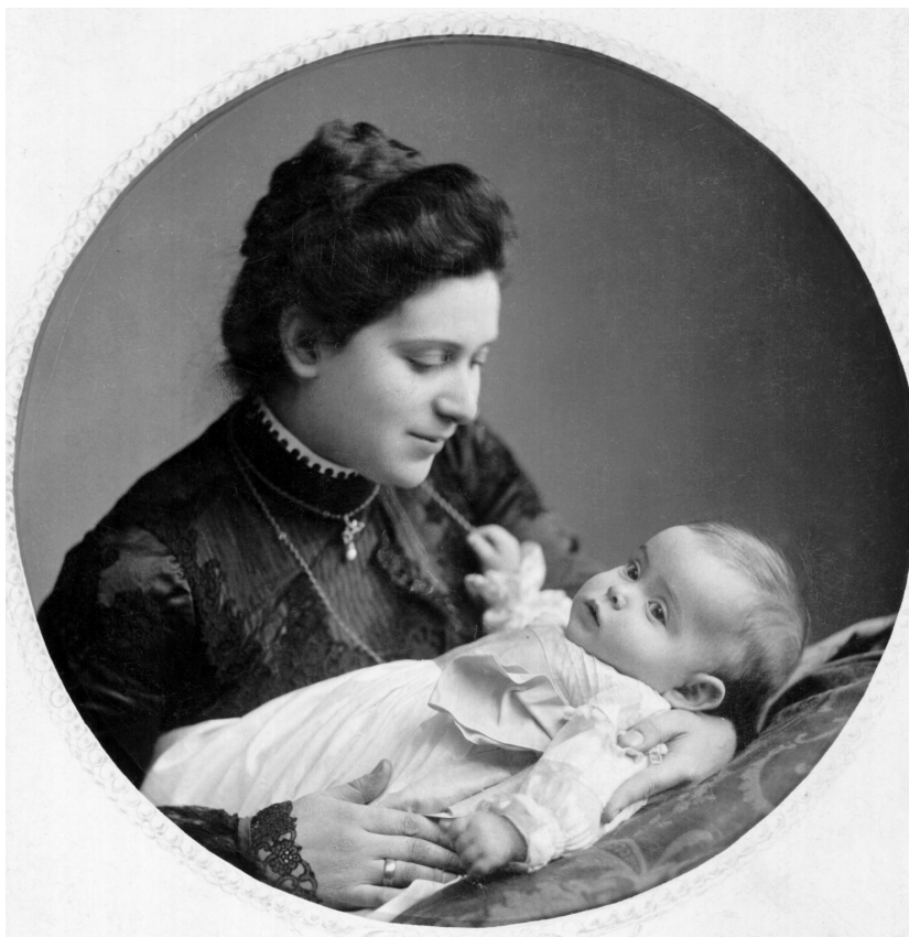
Anyai nagyanyám első kislányával, 1901

– Anyai nagyanyám házában nőttünk fel, valójában ő nevelt minket. Hat elemijével nem volt értelmiségi, de orvosfeleségként sok mindent megtanult. Igazi családanya volt. A Váci utcai angol-kisasszonyokhoz járt iskolába, itt találkozott az elkötelezett istenhittel. Aztán nagyon fiatalon férjhez ment, Somogyi nagyapám pedig nem volt vallásos ember. Nagyanyám 1913-ban, azután tért meg véglegesen, miután első három gyermekük meghalt. A Szent Szűz segítette át őt azon a mély depresszió, amit ezek a tragédiák váltottak ki benne. Haláláig skapulárét viselt, hajnali fél ötkor már ott ült az ágya szélén, és mondta a Rózsafüzért. Édesanyám viszont „modern” keresztény volt, ebben édesapját követte, aki a századelő minden szellemi kalandja iránt érdeklődő, világi ember, koncertjáró, nagy operarajongó volt. A mondását, hogy – „Hegyét letről, templomot kintről, kocsmát bentről” – nagyanyám fejszólva idézte, hozzátéve, hogy pedig nagyapa alkoholt véletlenül sem fogyasztott. A már említett népegészségügyi könyvében nagyon komoly fejezet található az alkoholizmus veszé-