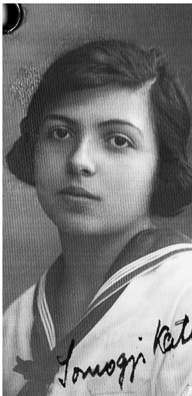
Édesanyám érettségi képe, 1921