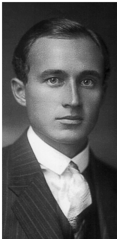
Édesapám, 1930 táján