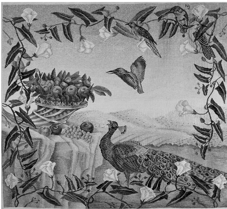
Csendélet pávával (1984)

Az E/3. személyű narráció erősen fokalizált, leginkább Ág János belső nézőpontja dominál, de olyan elbeszélői „befecskendezéssel”, ami sokszor ehhez hasonló részleteket hoz létre: „Maga sem tudta nagyon, bizonyos helyeken miért nem jött ki neki a lépés. Mintha valaki lenyúlt volna valamit. Mintha valakik lenyúltak volna mindent. A szavakat leginkább. [...] Persze. Szöveg akkor is, azután is létezett. Szövegek. Amelyekkel sebtében be lehetett takarni a hirtelen beálló kínos csöndek.” A maga nyomasztó mivoltának ellenére is észre kell vennünk itt az irodalomelméleti átkacsintást Barthes „mű és szöveg”-fogalmára: „[...] a Szöveg a jelölt vég nélküli elhalasztódását végzi: a Szöveg késleltető; tere a jelölőé. A jelöltöt nem szabad »a jelentés első pillanatának«, a jelentés előszobájának tekintenünk, hanem inkább annak utóhatásának. Ugyanígy, a jelöltő vég nélkülisége sem valamilyen kimondhatatlanságra utal (egy megnevezhetetlen jelöltre), hanem a játékra.” Bár – mint látjuk – a francia irodalomtudósnál egy sokkal örömtelibb, játékosabb, vég nélkül elhalasztó-