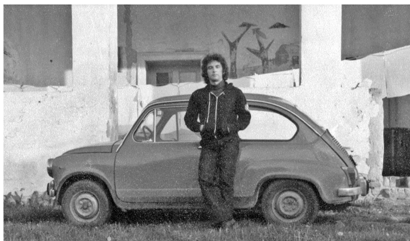
Első járművem egy narancssárga Zastava 750-es volt. A kép 1977-ben készült.

gam is sok helyen megfordultam már, és igenis fontosnak érzem, hogy jól nézzenek ki azok a terek és látványosságok, amiket az ide látogatók felkeresnek. Mindez persze a helyiek szempontjából is ugyanilyen fontos, mert jó érzés ilyen környezetben élni. Az a szerencsém, hogy viszonylag messze van a munkahelyem, így minden nap gyaloglok hét-nyolc kilométert, két etapban. Milyen jó dolog átmenni a Margit hídon! Maga a híd is gyönyörű, és ha jó az idő, megállok, és nézem, milyen csodálatos ez a város. Szóval a 2009-es pesszimista, szomorkás hangulatom megváltozott. Ma már kellemesnek tartom Budapestet.