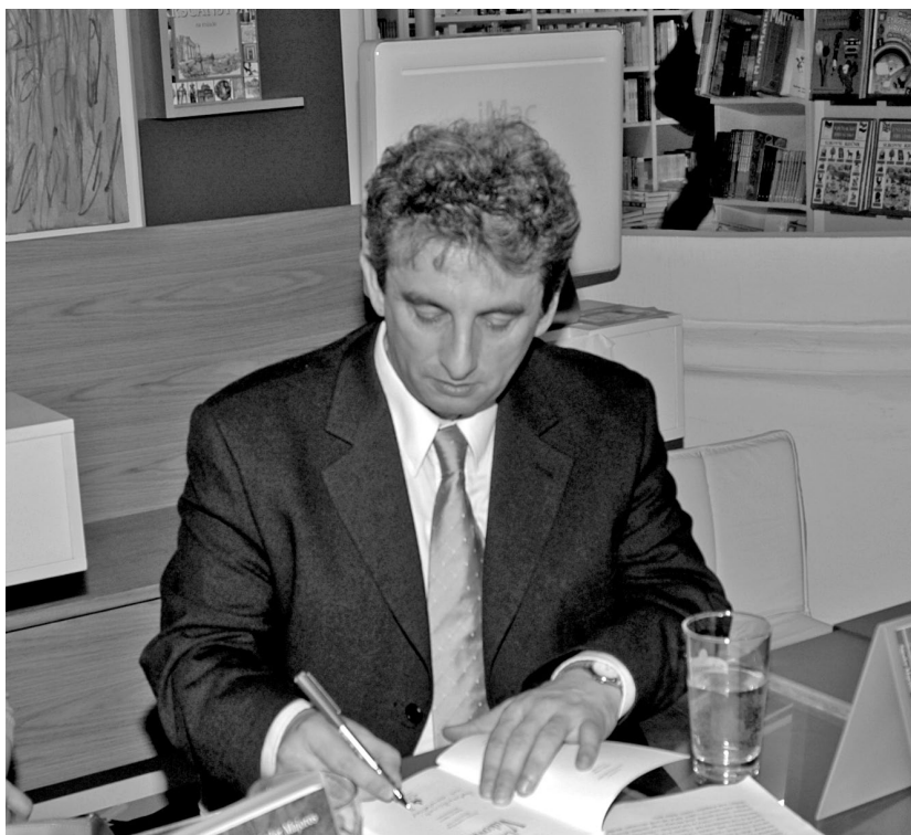
A Meghalni Vukovárnál horvátországi kiadásának bemutatóján Zágrábban 2005-ben.

– Nagyon hamar megfogalmazódott bennem, hogy az irodalmat és az internetet össze kellene házasítani. 2004-ben létrehoztam a Regénytárat, ami kezdettől fogva kísérleti terep volt, nyíltan vállaltam, hogy ez egy próbálkozás, ami a net és az irodalom közötti kapcsolat megteremtését célozza. Ösztönös megérzés volt, hogy az emberek nem szeretnek hosszú szövegeket olvasni a képernyőn, tehát rövidebben kell írni, és más nyelv kell az internetre, mint ami a könyvekben van; szabadabb, lazább, lényegre törőbb és vidámabb. Ezt próbáltam megvalósítani a Regénytárban. A nehézséget az okozta, hogy ezt mindig olyan szinten magánügynek tartottam, hogy senkit sem vontam bele. Ha valaki jelentkezett, hogy betársul, akár pénzzel, akár más segítséggel, én mindig elhárítottam, mert attól tartottam, hogy az illető a tartalomba is be fog avatkozni. Teljesen egyedül akartam vinni ezt az oldalt. Éppen ezért a Regénytár eléggé izoláltan megy már tizennégy éve, csak az tud róla, aki véletlenül megtalálja. Azóta sokan csináltak hasonló oldalakat, tele van diletáns lapokkal a net. Az a szörnyű ebben az egészben, hogy megszűnt a régi szerkesztőségek által működtetett szűrőrendszer. Annak idején, ha az újvidéki Híd elfogadott egy írást, két évet is kellett várni a megjelenésre. És két év után, amikor megjelent a novellád,