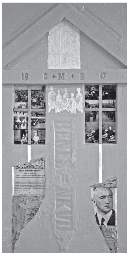
Kalita Gábor: A mi házunk már nem a miénk