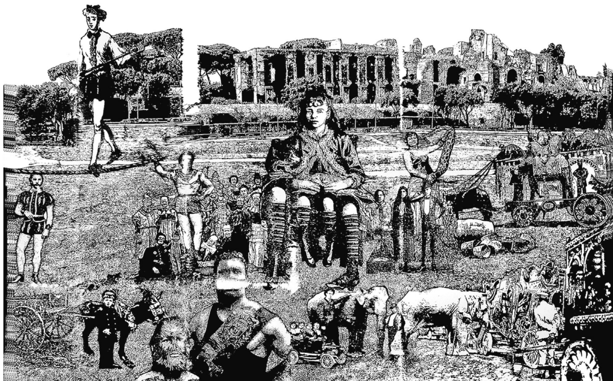
Circus Maximus (2012, tollrajz, tus)

A mellettem lévő ágyban egy nálam néhány évvel fiatalabb, de évtizedekkel elesettebb öregember feködött. Valamilyen gyomorműtétet hajtottak végre rajta. Hanyatt fekszik, karjába lóg az infúzió, álla leesett, nyelve fehér, meg se moccan – néha gyanakodva nézek rá, él-e még? Nem szeretném, ha meghalna. Láttam holtakat, talán sokat is, saját alvadt vérükben fekvő cafat-testeket, derékig szénné égettet, mintha csak békésen aludna, keményre fagyottat, de eddig senki nem lehelte ki tőlem méternyire a lelkét. Valójában nem akarom látni, hogy miféle tudat nélküli mozgások, hangok kíséretében végzem, ha ideje eljő – és jó. Ha már annyi mindent megúsztam, valószínűleg ágyban és párnák közt.