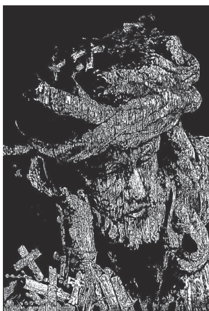
Kis kereszték hegye (2014, linómetszet)