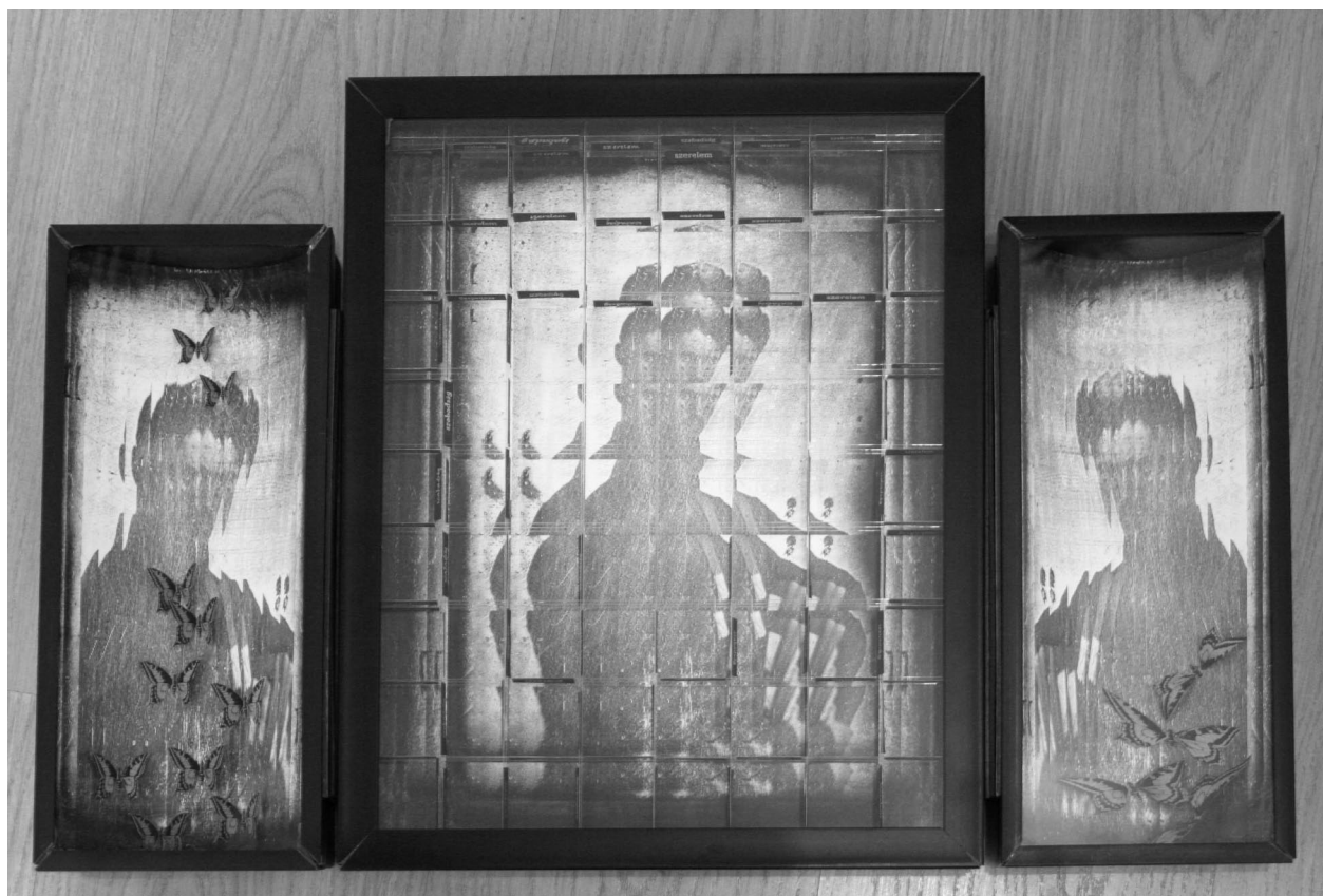
Szekeres Ferenc: Pseudo leletek (2013)