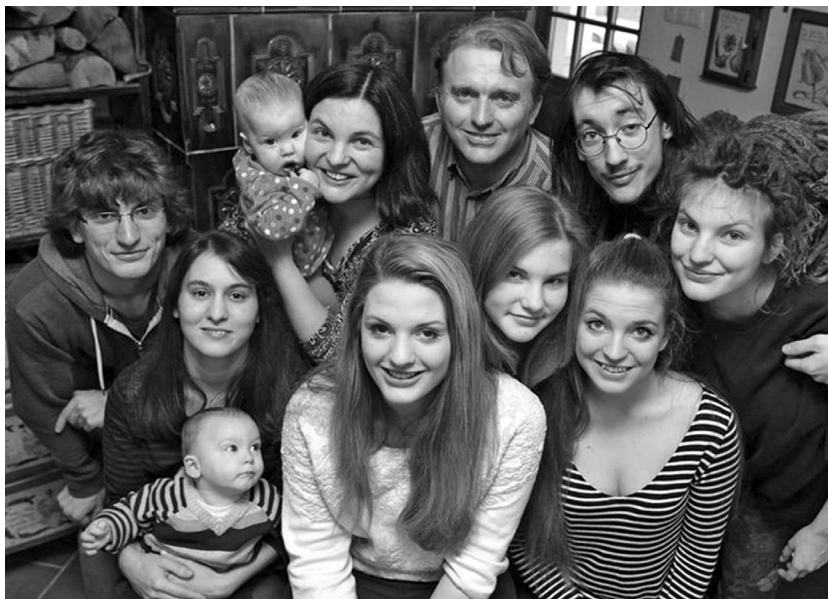
Családi kör három éve

– Hat gyerekemre cseppet sem akartam rátukmálni az irodalmat. Talán ha nem jön össze nekem az íróvá válás, lelki kényszerből létrehozok itthon egy Guantanamót, és bosszúból kinevelem a lehető