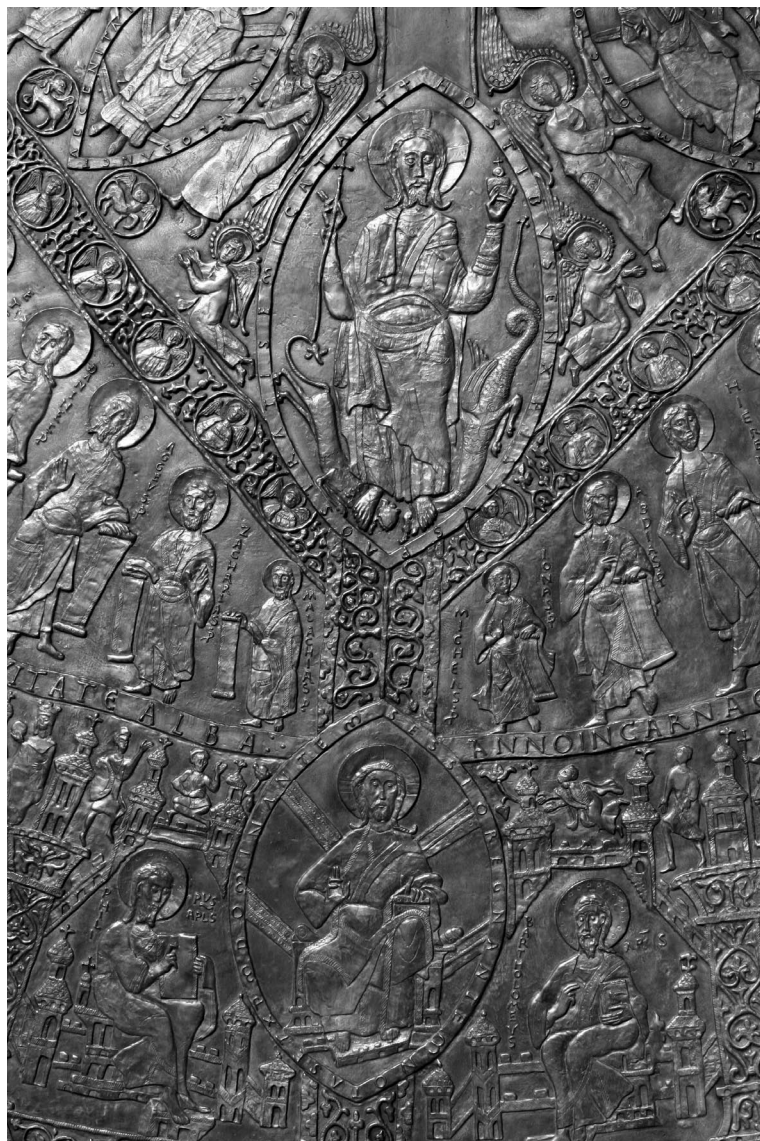
Rieger Tibor: A magyar királyok koronázási palástja (2000–2004, Budapest, avatás: 2017)

A domb innenső aljában kis patakocska csörgedezett, de nem is csörgedezett, csupán folydogált hangtalanul, szemérmesen, hangját elnyelte a part dús növényzete. A szorgalmas kis halak hang nélkül cipelték tova, talán a tenger felé, ahova Kalagyula is vágott. Azért tanult meg úszni, hogy ha egyszer