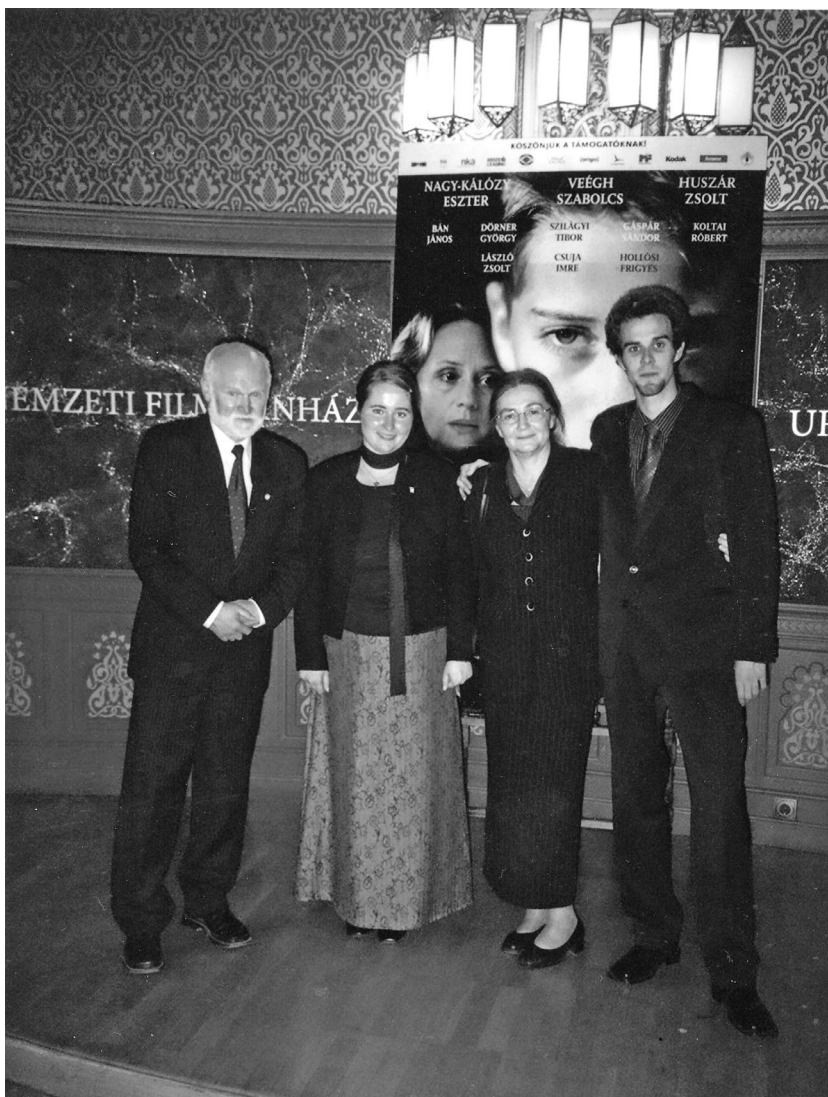
Családom társaságában A gyermekkor tündöklete című regényből készült Budakeszi srácok című film díszbemutatóján, 2006. október 22-én

A kiállítást – emlékezetem szerint – a krakkói Nemzeti Múzeum is bemutatta 1995 elején. Ott megvett katalógusát azóta is gyakran