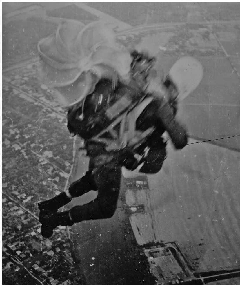
Az első ugrásom Szolnok fölött.