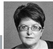
Māra Zālīte (1952, Krasznajarszk) lett költő, író, Herder-díjas