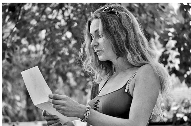
Spanyolnátha Kertfesztivál, Hernádkak, 2016

– Nem kell beléjük halni. A versek arra valók, hogy segítsenek élni, a vers a gyógyszer, nem a betegség. A versírás többek közt öngyógyító művelet, és bizakodom, hogy befogadói oldalon is beválik majd. De elárulom, hogy néha vágyvezérelt verseket írok, megírom, hogy mit szeretnék, hogy legyen, mivel többször valóra vált már, amit így megírtam. Persze nem éppen vágyvezérelten, de a koronavírust is meg-