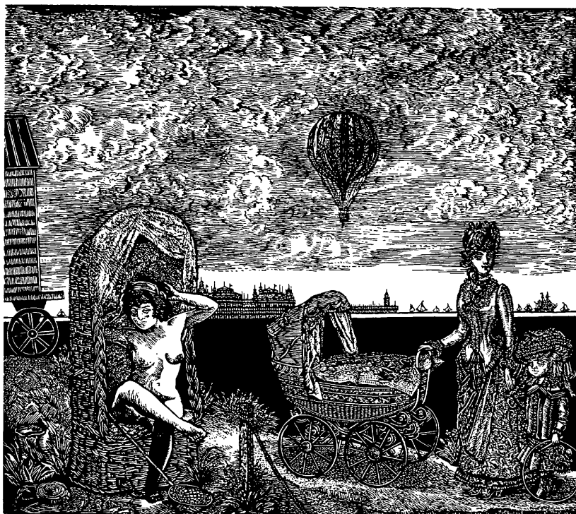
Nagymamák tengerpartja (linóleummetszet, 355 × 400 mm, 1987)

és a magyar íróársadalmat. Munkássága eredménye elvülhetetlen maradt.