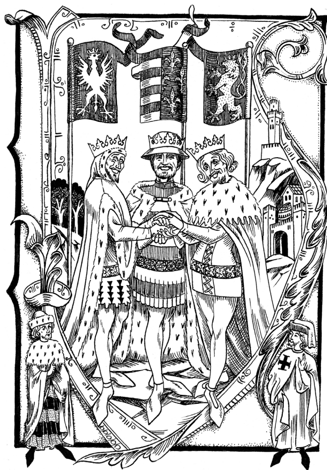
A visegrádi találkozó