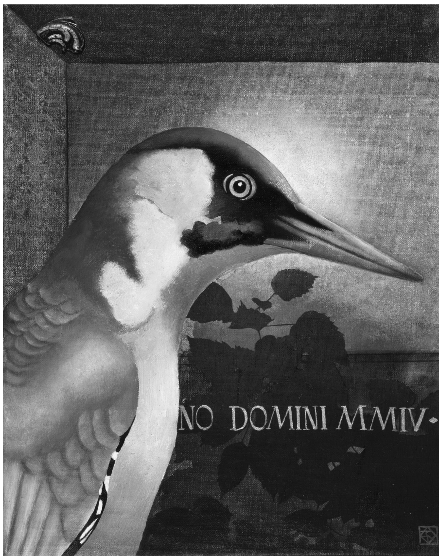
Zöld küllő Katinak (51 x 40 cm, olaj, farost)

E tanulmányak a témát felvillantó alcíme: Csillag Tibor és a pesterzsébeti reneszánsz . Csillag Tibor ugyanúgy nem került be az irodalmi köztudatba, mint Bérei Géza. „Kárpáti ifjúsága hét és fél évét töltötte börtönökben. Csillagtól két és fél évet raboltak el. De amíg Kárpáti Kamilt nem tudták két vállra fektetni ezek a pokoli évek, Csillag Tibort egy életre megtörték. A börtön után egyetemi tanulmányait nem folytathatta. 1960–70 között